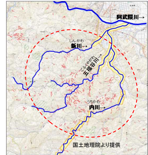
国直轄による砂防事業要望範囲 国権限代行(河川)

甚大な土砂災害が発生した阿武隈川水系内川流域での土砂災害に対し、砂防堰堤等の整備による土砂流出防止対策工事を実施