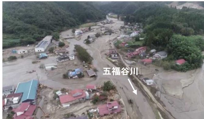
五福谷川: 土砂・洪水氾濫による被害

甚大な土砂災害が発生した阿武隈川水系内川流域での土砂災害に対し、砂防堰堤等の整備による土砂流出防止対策工事を実施