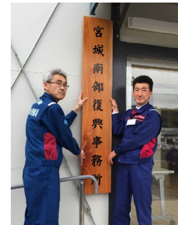
看板掛けの様子(4月1日)

国道349号の宮城県丸森町内の約14kmについて、復旧工事を実施 特に被災の大きかった約8kmにおいては、山側への別ルートで復旧工事を実施