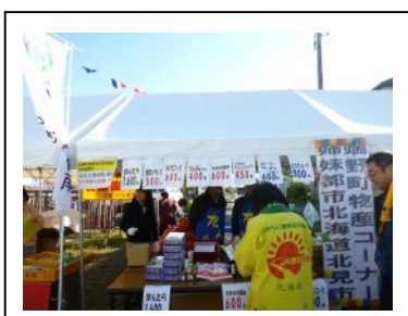
平成25年度のJAフェスティバルの様子

今年も端野町特設コーナーを設けて、玉ねぎやじゃがいもなど端野町の特産品を特別価格にて販売します。端野の物産品は大人気で即日完売する商品もございますので、お早めに足をお運びください。なお、商品が売り切れの際はご了承ください。また、会員限定特典として端野町産「玉ねぎ」の無料引換えを行います。(11月1日(土)のみ 時間限定 先着100名様限定。詳しくは裏面をご覧ください。)多くの方のご来場をお待ちしております。