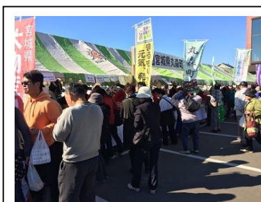
平成26年度端野農業物産フェアの様子

今年は“米粉のワンタン”や“しそ巻らっきょ”などの試食を行い、全ての商品を完売することができました。また、物産販売を通して端野町と交流を行ってきました。