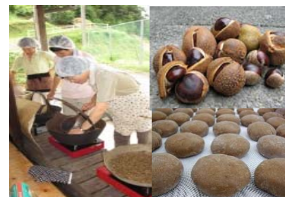
地域製品の加工 及び商品化