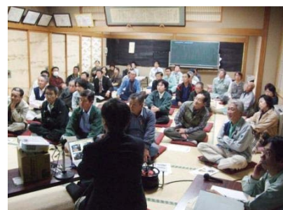
合意形成・計画づくり