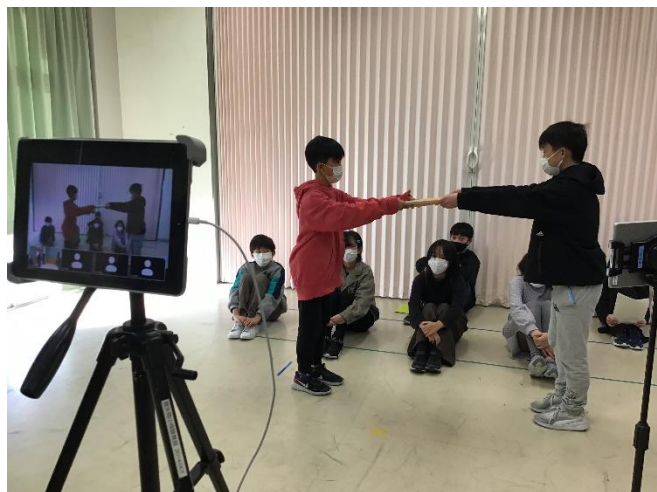
【縦割り引継式（オンライン）】

三寒四温で暖かい日が増えて、徐々に春の訪れを感じられるようになりました。今日から3月です。子供たちにとっては、卒業や進級を控え、一年間のまとめの時期となります。6年生は卒業に向けて小学校生活の総仕上げをしています。一人一人の行動の中に残り少なくなった小学校生活を精一杯に過ごそうとしている様子がうかがわれます。希望を胸に大きく羽ばたいていくことを、職員一同願っております。また、1～5年生の子供たちは、進級を前に、学習や生活において1年間のまとめをしています。残りわずかな日々を、仲間と共に楽しく、そして有意義に過ごしてほしいと思っています。