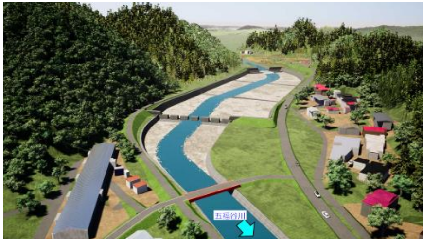
五福谷川遊砂地の整備イメージ（CG 画像）

そこで、この遊砂地をきっかけとした新たなコミュニティの形成や丸森町の観光資源、防災教育の充実に繋がることを期待し、主に日常の利活用を主眼としたワークショップを開催しました。