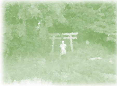
地域で大事にしている神社