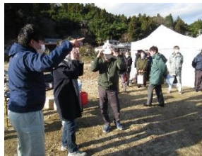
VRを活用した現地視察