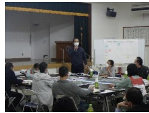
ワークショップの状況(第1回)