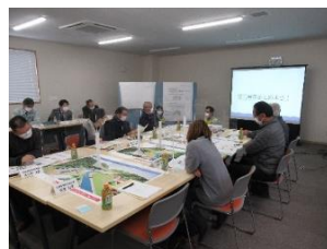
ワークショップの状況(第3回)