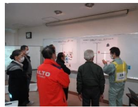
ワークショップの状況(第2回)