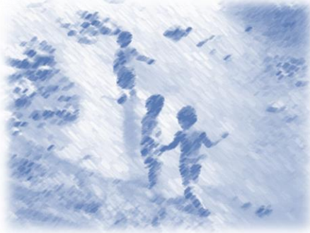
川に親しむイメージ