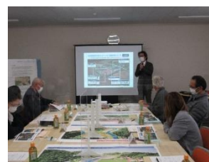
柴山准教授との意見交換