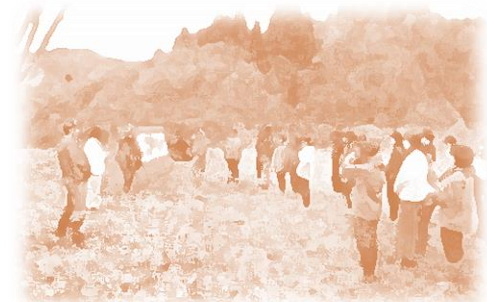
防災学習のイメージ