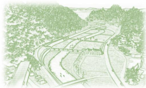
防災性を高める遊砂地のイメージ