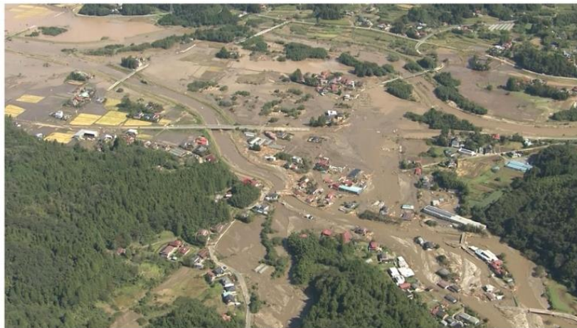
東日本台風による土砂・洪水氾濫の状況（令和元年 10月 15日撮影）

この災害を契機として、多くの家屋が被災した五福谷地区には遊砂地が整備されることとなりました。遊砂地が整備されることにより地域の防災性は向上しますが、地域住民の日常の暮らしや営みがあった五福谷地区周辺の景色も大きく変わるることになります。