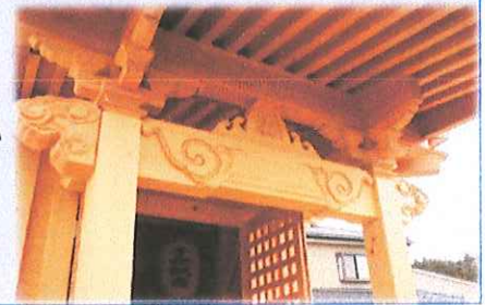
見事なお堂の彫刻