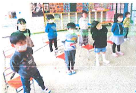
【みんなで虹の歌をうたいました】

4月から丸森小学校に入学する2名のおわかれ会をしました。思い出の歌やダンスと一緒に楽しんだり、年下の友だちからありがとうの気持ちをこめた手作りのえんぴつ立てなどのプレゼントと年長児2名からのメッセージ立てのプレゼントの交換をしました。プレゼントを見て「きれいだね」「かわいい」と両手で大事そうに抱え、嬉しそうにしていました。小学校に行ったら笑顔いっぱい1年生になって下さいね。