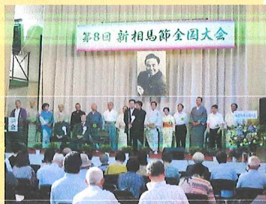
第8回新相馬節全国大会の様子。

大会を楽しみにしていた新相馬節愛好者の皆様、開催に向けてご準備をされていた皆様には第10回からの引き続きの中止決定となり大変申し訳ございませんが、参加来場者の皆様や関係者の方々の健康と安全を最優先と考えた結果とご理解頂きますよう何卒よろしくお願い致します。新型コロナウイルス感染症が終息し、再び大内の青空に新相馬節の歌声が響き渡ることを関係者一同心より祈っております。新相馬節全国大会 実行委員会