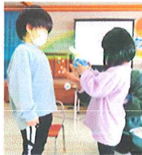
【お祝いのプレゼントを渡しました】