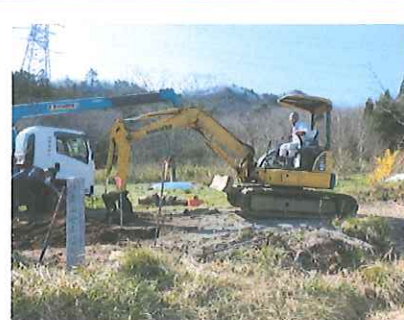
前の土台を撤去する様子

クレーンやミニショベルが出動し、順調に掘り進めます。新たな土台づくりをしました。