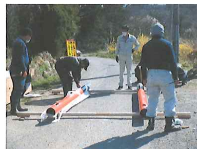
鳥居組み立て中。建てる前に壊さないように慎重に。