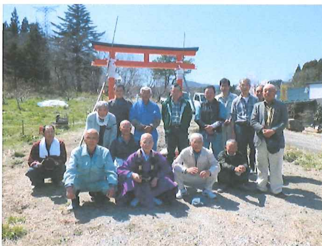
皆さんお疲れさまでした。