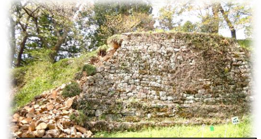
崩落した石垣の内部が見れるのは今だけ…！？貴重な機会とも思いました。(※4月撮影)