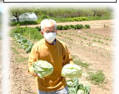
キレイなキャベツ、美味しくいただきました。