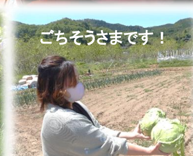
ごちそうさまです！