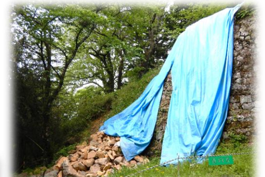
現在は立ち入り禁止範囲が広くなりブルーシートが掛けられています。※梅雨に入り、雨も多い時期になります。もし何か変化があった場合は自治会までお知らせください。