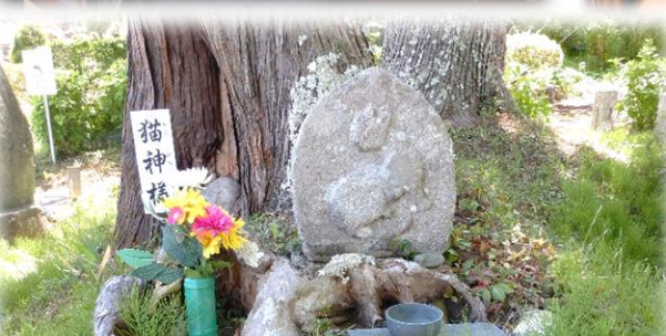
瑞雲寺の猫碑を撮影！金山のパンフレットのリニューアル計画、進行中です。