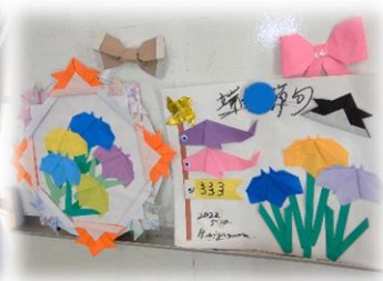
完成！素敵な作品が出来ました。