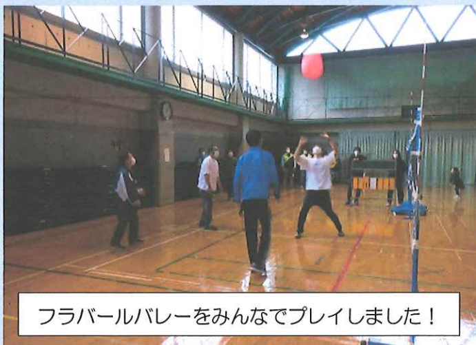
フラバールバレーをみんなでプレイしました！

大内体育協会主催のふるさと大内球技大会が6月12日(日)に2年ぶりに開催されました誰でもできるニュースポーツをみんなでやってみようということで、2チームに分かれてフラバールバレーをプレイしました。使用するボールが楕円で、バウンドしてもレシーブをしてもどこに飛んでいくか分からないため、かなりの運動量でした。