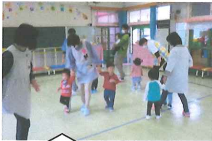
♪ダンスを踊ったよ♪