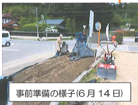
事前準備の様子(6月14日)