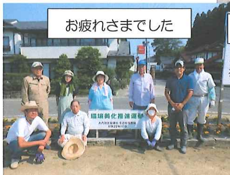
お疲れさまでした