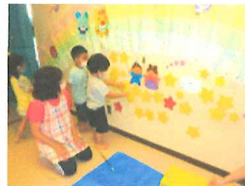
【織姫と彦星が会えるように釣った星を並べて天の川を作りました】