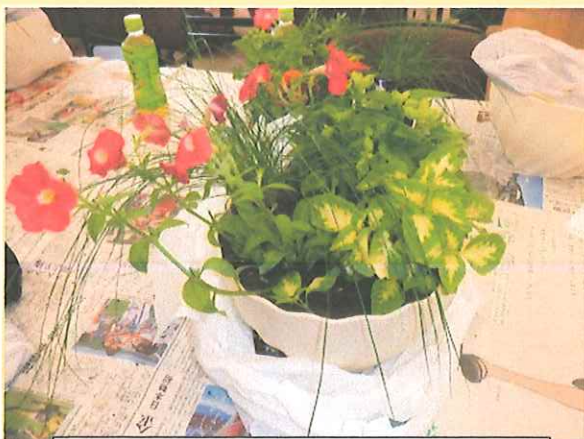
花だけでなく葉のみの苗もあります

6月28日(火)に開催されたJA女性部のガーデニングレッスンを取材させてもらいました。今日は花の寄せ植えです。マリーゴールドやトレニアなど5種類の花を鉢の中にバランスよく植えていきます。皆さん真剣に作業していました。