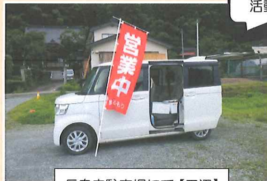
長泉寺駐車場にて【田辺】

いきいき交流センターでは7月22日(金)から毎週金曜日に移動販売を開始したそうなので、取材させていただきました。季節の野菜や漬物、焼き菓子など色々ありました。利用された方からは「車を運転しないので売りに来てくれるのはありがたい」との声もありました。期間限定での移動販売になるとのことなので、詳しくはいきいき交流センター大内(☎ 79-3151)までお問合せ下さい。