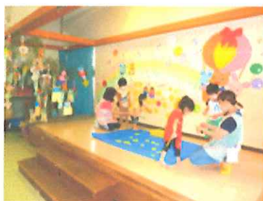
【釣り竿を使って星を釣りました】

七夕に向けて各クラス毎に輪つなぎや三角つなぎなどの笹飾りを作りました。飾った後には、「風に揺れてきれいだね。」と、喜んでいた子ども達です。7月7日(木)には、七夕まつり会を行い「たなばたさま」や「きらきら星」の歌を歌ったり、ゲームをしたりして楽しみました。ゲームが終わると「織姫と彦星が会えると良いね。」と、話していた子ども達です。最後は、一人ひとりの願いごとが叶うようお願いをしました。