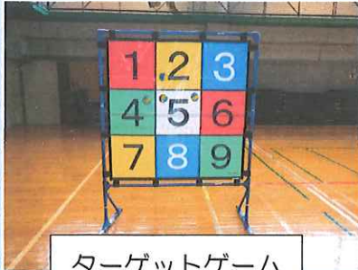
ターゲットゲーム

大内まちづくりセンターではニュースポーツレクリエーションの用具を貸し出しています。地区のお茶飲み会や集会などに活用して下さい。貸し出しや、どういうものかちょっと使ってみたいなどありましたら、大内まちづくりセンター（☎：79-2004）までご連絡ください。 【一部を紹介いたします】