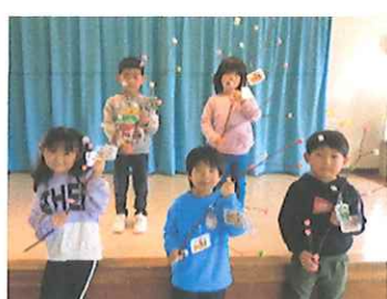
願い事が叶うよう、頑張ります。(4・5歳児)