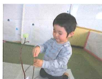
一人でできるよ。すごいでしょ。(1歳児)