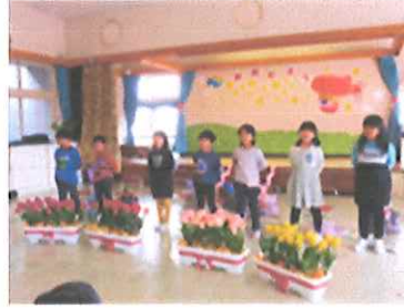
5歳児が「小学校に行ってもみんなのこと忘れないよ。」の気持ちを込めて♪ずっといっしょ♪の歌を歌ってくれました。

「卯月」山屋敷 平田喜一郎さん エイプリルをこいても屁はくかない ボヤーとして空を見上げりゃトビ舞う 歳し重もく立つも座るもよこいこ