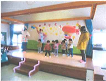
1歳児は、運動会で踊った「PON PON ポップコーンたいそう」を披露しました。

3月16日(木)に5歳児とおわかれ会をしました。前日、5歳児におわかれ会の招待状を渡すと、とても楽しみにしているようでした。当日は、「ありがとう」の気持ちを込めて、歌や踊りのプレゼントをしました。また、1歳児から4歳児がそれぞれに手作りしたフォトフレームや鉛筆立てなどもプレゼントすると喜んでいた5歳児です。最後は、スライドショーを見て保育所での思い出を振り返りました。