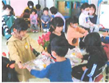
手作りのプレゼントを感謝の気持ちを込めて「ありがとう」と、言って渡しました。