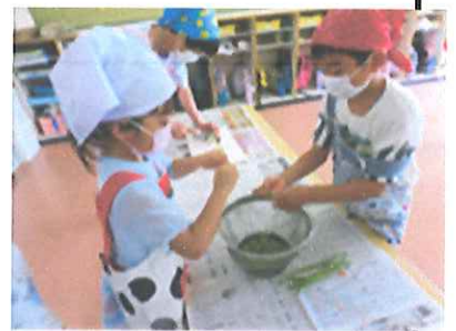
【いんげんを細かくしてます】