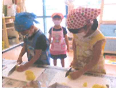
【包丁はドキドキしました】