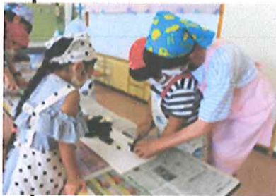
【大人と一緒にだと安心だね】

8月4日(金)に夏野菜カレークッキングを行いました。わくわく畑の野菜（ナス・ピーマン・パプリカ）を収穫し、食生活改善推進委員の方と婦人会の方にお手伝いをしてもらいながら、一緒にカレークッキングをしました。包丁やピューラーを手に持つと真剣な表情になる子ども達、手元を見て集中しながら野菜を切りました。インゲンは手でポキポキ折ると初めての感覚と歯切れ良い音に大喜び！包丁を使わなくても調理ができる事を知った子ども達でした。自分たちで作ったカレーは一段と美味しく、人参は可愛く型抜きをしたこともあり「これ僕の人参だよ」と目でも楽しみながら完食した子ども達でした。