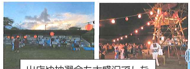
出店や抽選会也大盛況でした

今年は各地区で盆踊りが開催されました。久々の夏祭りとあってたくさんの方々が踊りの輪に加わっていました、ふるさと大内の夏の夜に歌と笑い声が響いていました。