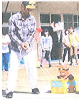
【うさぎ組・未入所児親子競技】