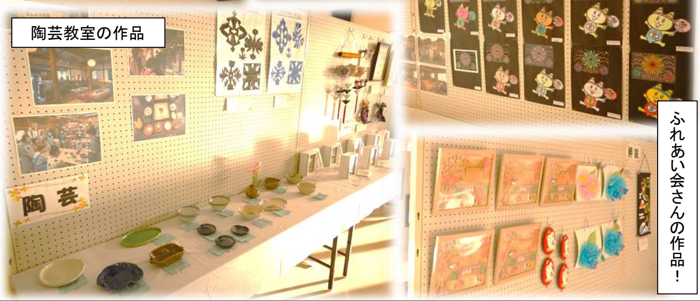
ふれあい会さんの作品!