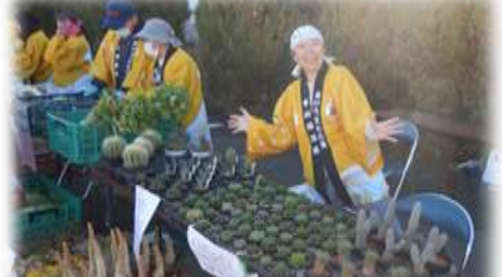
いつも元気な1000'sのセンさん