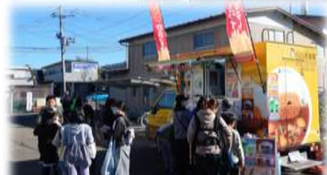
メロンソーダも大人気。ココイチさん