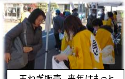
玉ねぎ販売、来年はもっと増やそうと思います。