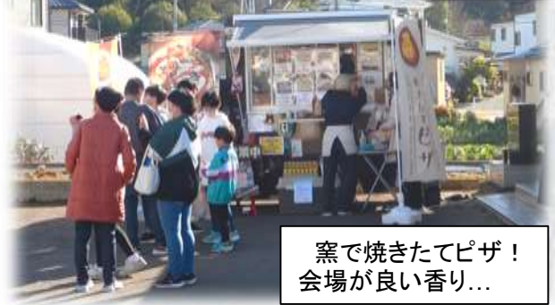
窯で焼きたてピザ！ 会場が良い香り...