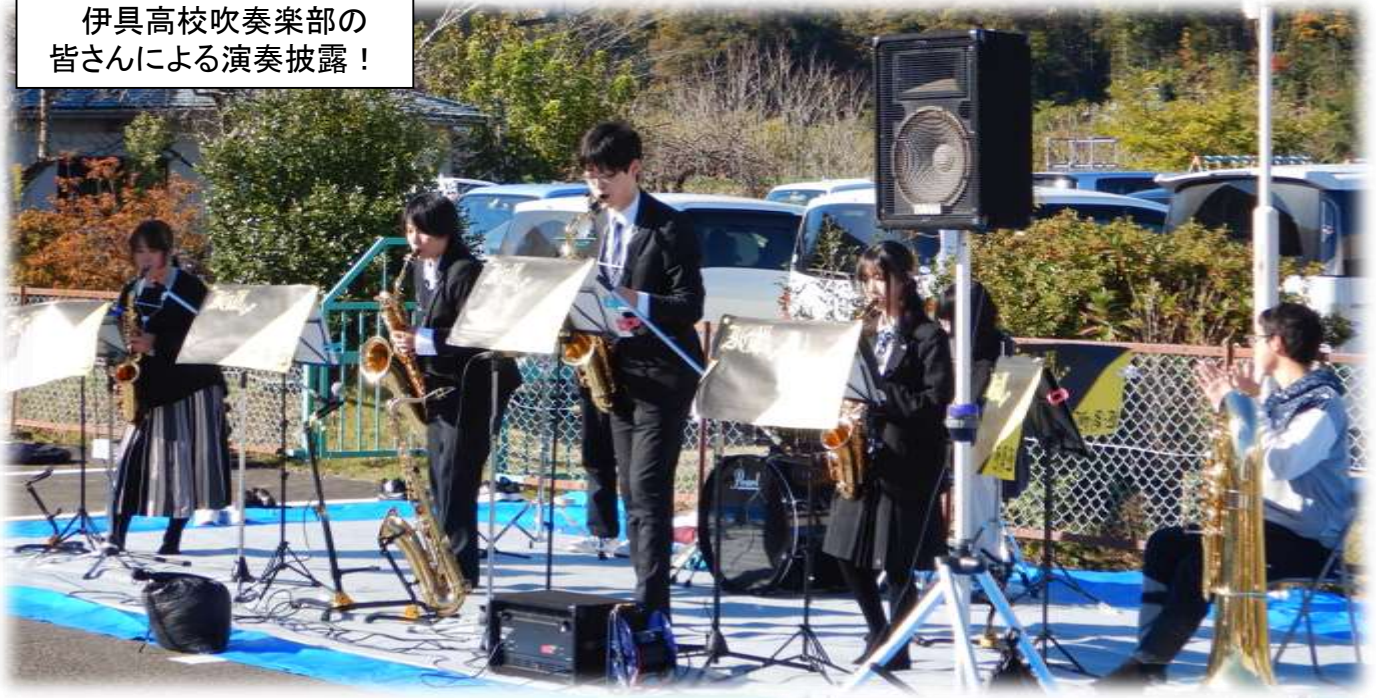
伊具高校吹奏楽部の 皆さんによる演奏披露！