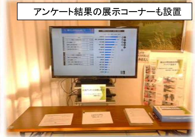
アンケート結果の展示コーナーも設置