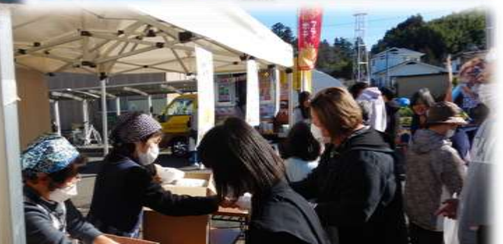
「豊穰弁当」の振る舞い。 金山食19会の皆さん、ありがとうございました。