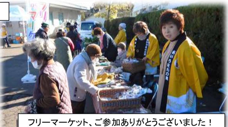
フリーマーケット、ご参加ありがとうございました！