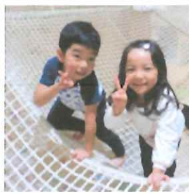
ボルダリングを登ったよ