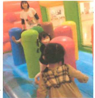
エア遊具は、フカフカでした