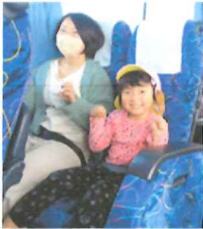
バスに乗って、出発！

11月2日（木）に3・4・5歳児の子ども達が南相馬市にあるNIKOパークへ親子遠足に行ってきました。この施設は、ネット遊具のほかに、ボルダリングやエア遊具など、ダイナミックに体を動かして遊べる遊具がそろっています。天井に吊ってあるネットに登ってジャンプしたり、転がったりして、大喜びで遊んでいました。また、エアが入った大きな滑り台では、何度も滑ったり、飛び跳ねたりして大興奮でした。ワークショップでは、「傘袋ロケット」のおもちゃ作りも体験しました。お父さんやお母さんも一緒だったので、いっぱい遊んでもらった子ども達は、ニコニコ笑顔で一日を過ごし、楽しい思い出になったようです。