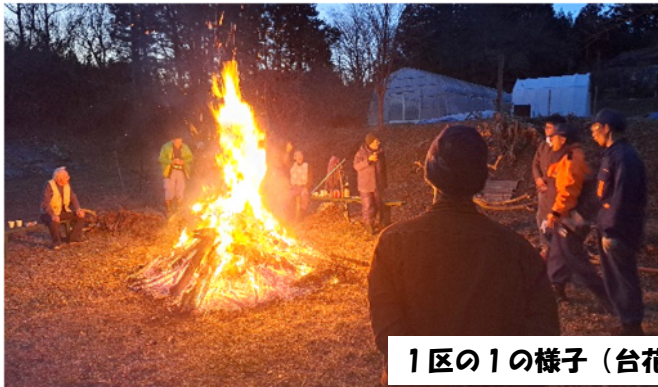
1区の様子（台花壇付近）