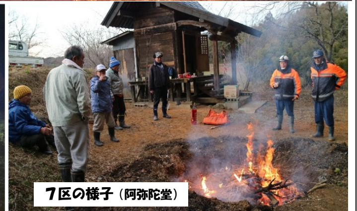
7区の様子（阿弥陀堂）