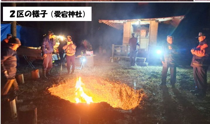
2区の様子（愛宕神社）