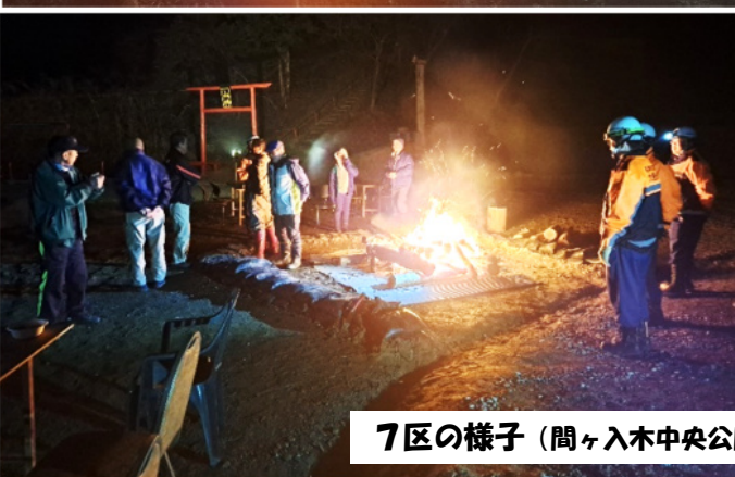
7区の様子（間ヶ入木中央公園）