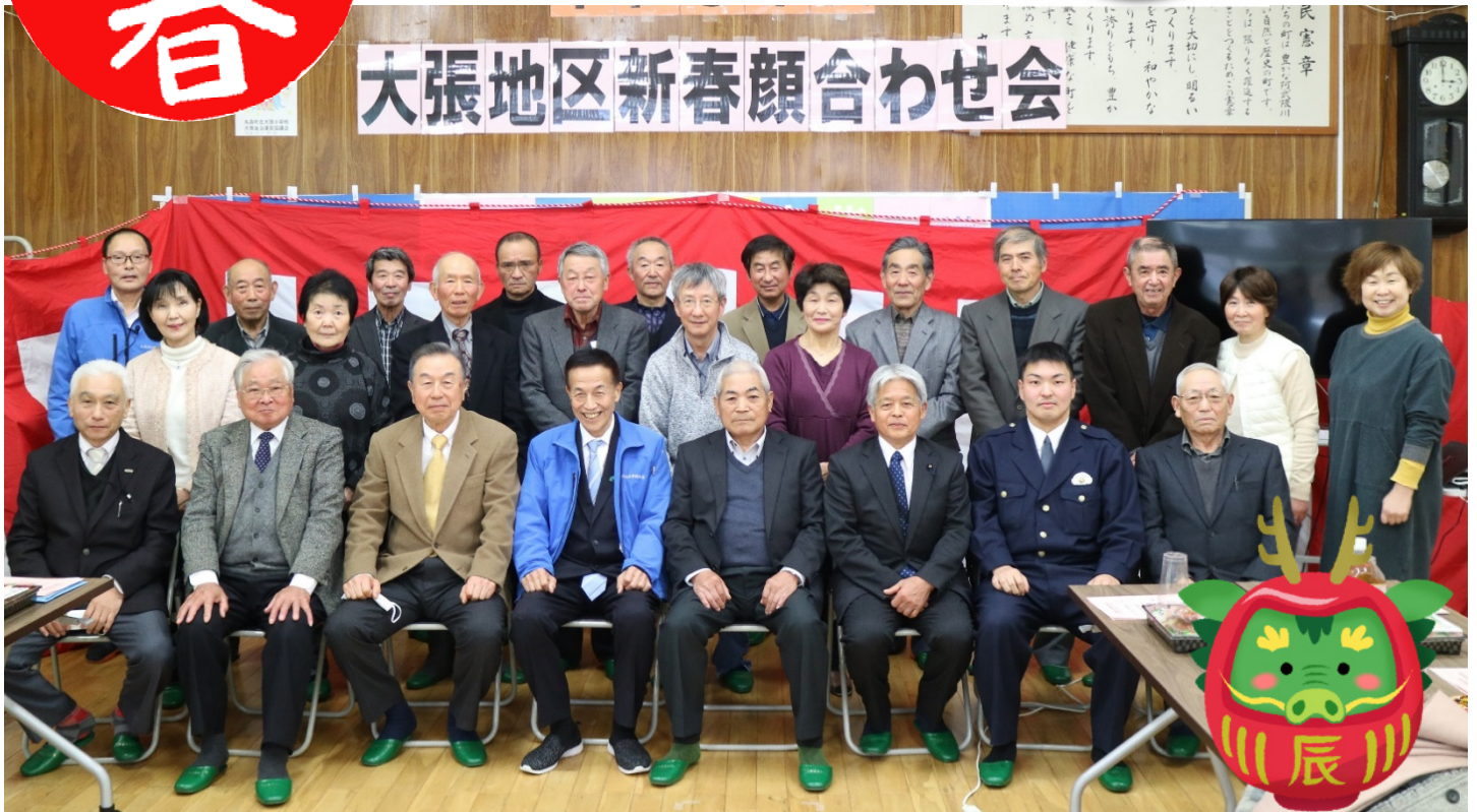
1月18日（木）令和6年 大張地区新春顔合わせ会が開催されました。（4ページ掲載）