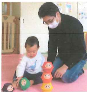
=うさぎ組(0歳児)= 一緒に遊んだよ

1月31日(水)に今年度最後の保育参観がありました。保護者の方には、保育講座で「絵本のあ る子育て」のお話を聞いたり、お子さんの様子を参観していただいたりしました。うさぎ組(0歳児) では、手作り玩具で遊んだり、簡単マッサージ(スキンシップ)やふれあい遊びをしたりしました。 ぱんだ組(2・3歳児)は、運動遊びをしたり、制作「パクパクもりもり食べる子ちゃん作り」をし たりしました。ぞう組(4・5歳児)は、「早寝早起き朝ごはんすごろく」を作って、親子で遊びまし た。子ども達にとってお家の人と一緒に過ごす時間は、嬉しくて楽しい時間です。笑顔いっぱいの一 日になりました。