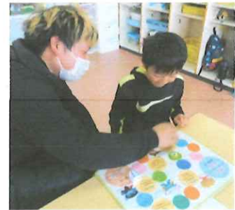
=ぞう組(4・5歳児)= 早くゴールできるのは どっちな