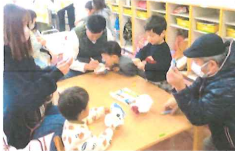
=ぱんだ組(2・3歳児)= パクパクもりもり 食べる子ちゃん制作中