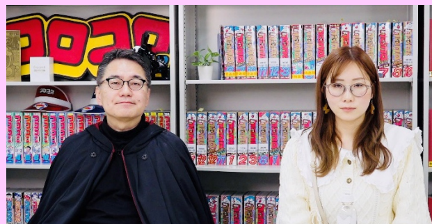
【YouTube「たえたそちゃんねる」配信中】

さて先日東京の小学館本社に行ってきました。コロコロコミックという有名な漫画本とのコラボ撮影だったのですが、ムシキングというゲームの開発者の方と対談をしました。詳しいことはコロコロコミック公式YouTubeチャンネルに動画が載っています。まさか自分が小学館本社に行くことになるとは思ってなくてとても貴重な経験でした。今年はテレビに出る仕事や沢山メディアに出れるよう頑張りたいと思います。