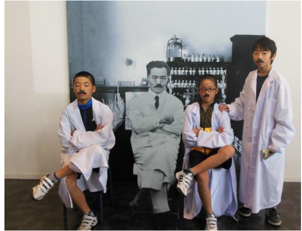
野口英世記念館にて(修学旅行)