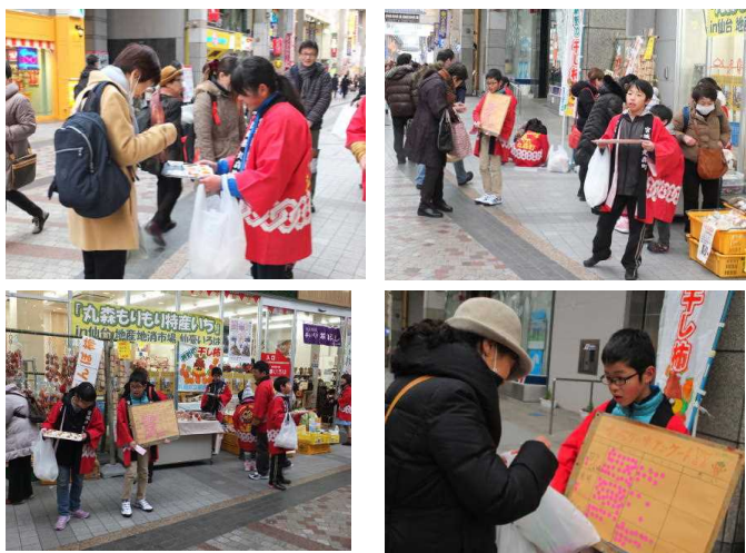
街頭での試食，アンケートの様子

丸森町町長さんをご来店くださいました。子どもたちも大喜びでした。ありがとうございました。