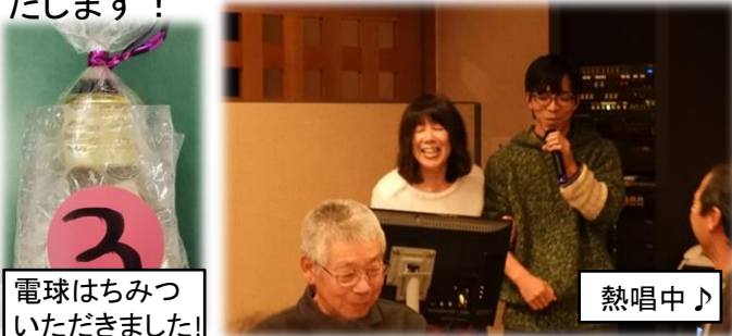
電球はちみつ いただきました!

本年も耕野がよりよい地域になっていくよう活動してまいりますので、どうぞよろしくお願いいたします!