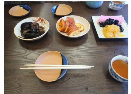
ささやかながら家族でおせち料理をいただきました。