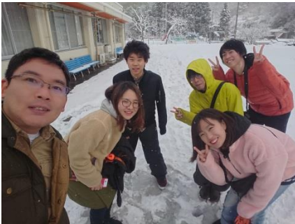
協力隊と大学生と高校生、なかなか珍しい組み合わせでした。

大みそかには、家族が来訪し、年越しそばやおせち料理を作り、父と兄と3人でのんびりと過ごすことができました。