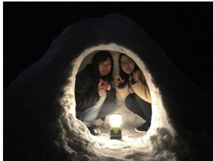
完成したかまくらに入って記念写真。