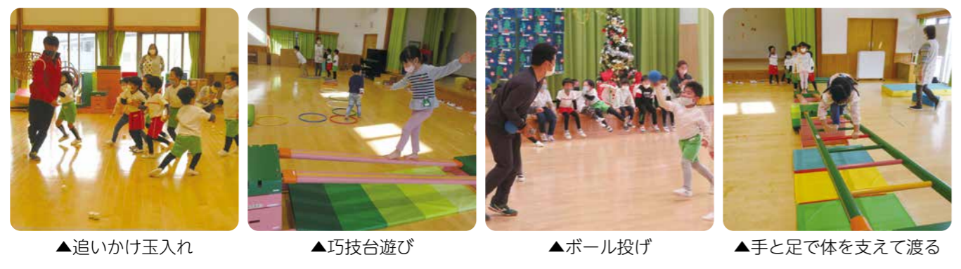
▲追いかけて玉入れ ▲巧技台遊び ▲ボール投げ ▲手と足で体を支えて渡る

仙台大学の先生方を講師にお招きして行っています。運動を通して転がる、支える、投げる、ストレッチ、かけっこなど、日常ではなかなか経験できない動きをすることで全身を上手にコントロールする力を養う事ができます。様々なジャンルの運動を子どもたちも楽しみながら取り組んでいます。