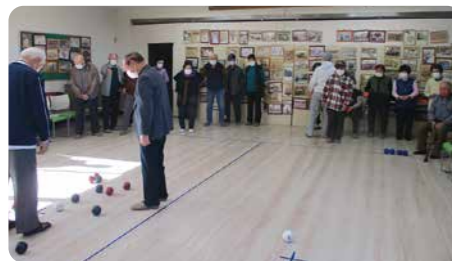
▲チーム対抗で大盛り上がり

丸森町社会福祉協議会では町からの委託を受けてシニア元気クラブ事業を行っています。地域に住むシニア世代の交流や介護予防、生きがいづくりを目的に各地域で順次開催する予定です。今年度は、丸森町老人クラブ連合会との共催でユニバーサルスポーツのポッチャを実施しています。