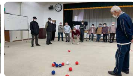
▲点数発表にドキドキ