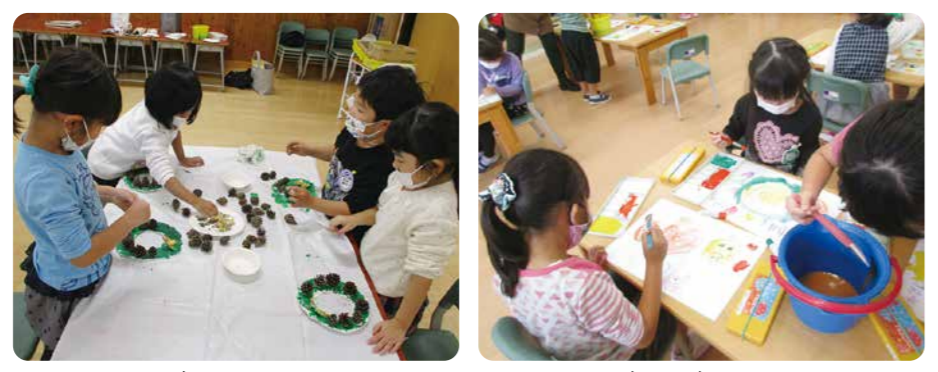
▲何ができるかな～! ▲実物を見ながらかぼちゃの絵を描きました

サンマやかぼちゃなど旬の食べ物を見ながら絵を描いたり、フェルトでハロウィンの帽子を作ったりするなど、季節ごとに様々な製作活動を楽しんでいます。思い思いに表現し、できあがると「できたよ!」と先生や友だちに見せ、とても喜んでいます。