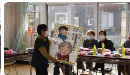
▲防犯かるたで詐欺予防