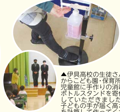
▲伊具高校の生徒さんからこども園・保育所・児童館に手作りの消毒ボトルスタンドを寄付していただきました。子どもの手が届く高さを計算して作ってくださったそうです。