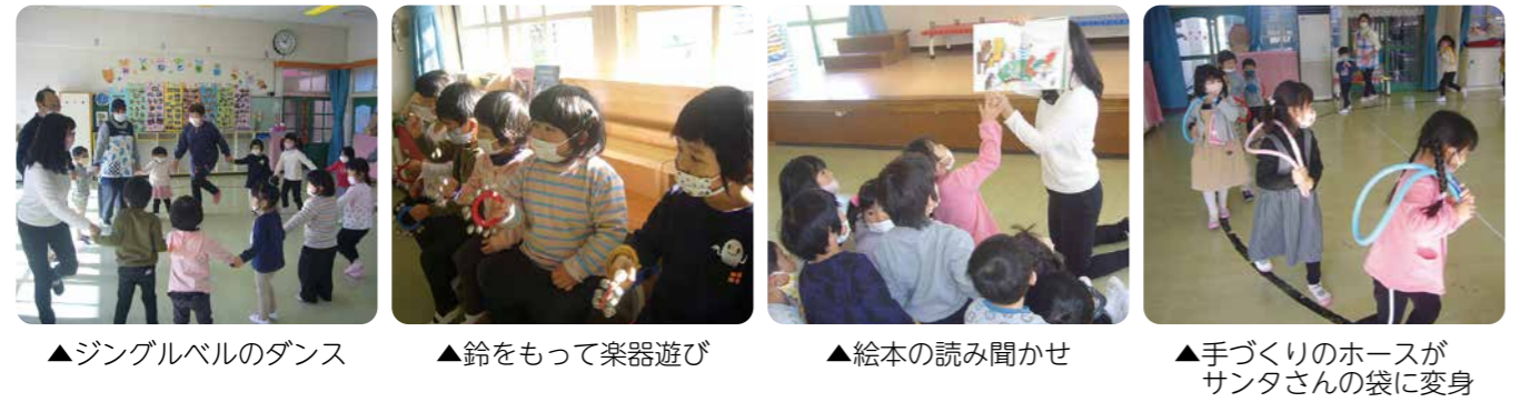
▲ジングルベルのダンス ▲鈴をもって楽器遊び ▲絵本の読み聞かせ ▲手づくりのホースがサンタさんの袋に変身

ピアノに合わせての歌やリトミック、絵本の読み聞かせ、季節に合わせたダンスや歌遊びなどを行っています。子どもたちは「今日は何をするのかな・・・」とわくわく感いっぱいクラブ活動の日を待っています。