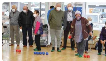
▲的を狙って慎重に