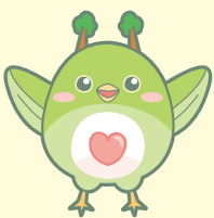
丸森町社会福祉協議会 マスコットキャラクター うぐたん