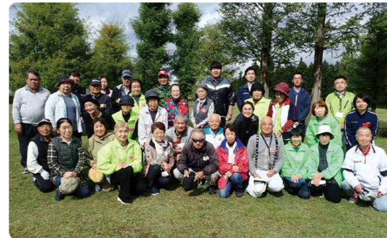
▲10月22日 令和3年度交流会の様子 (川崎町健康福祉センター多目的広場)

仙南地方ボランティア連絡協議会の事務局は各町が持ち回りで行っています。来年度は丸森町が事務局となり、交流会の開催地も丸森町となります。