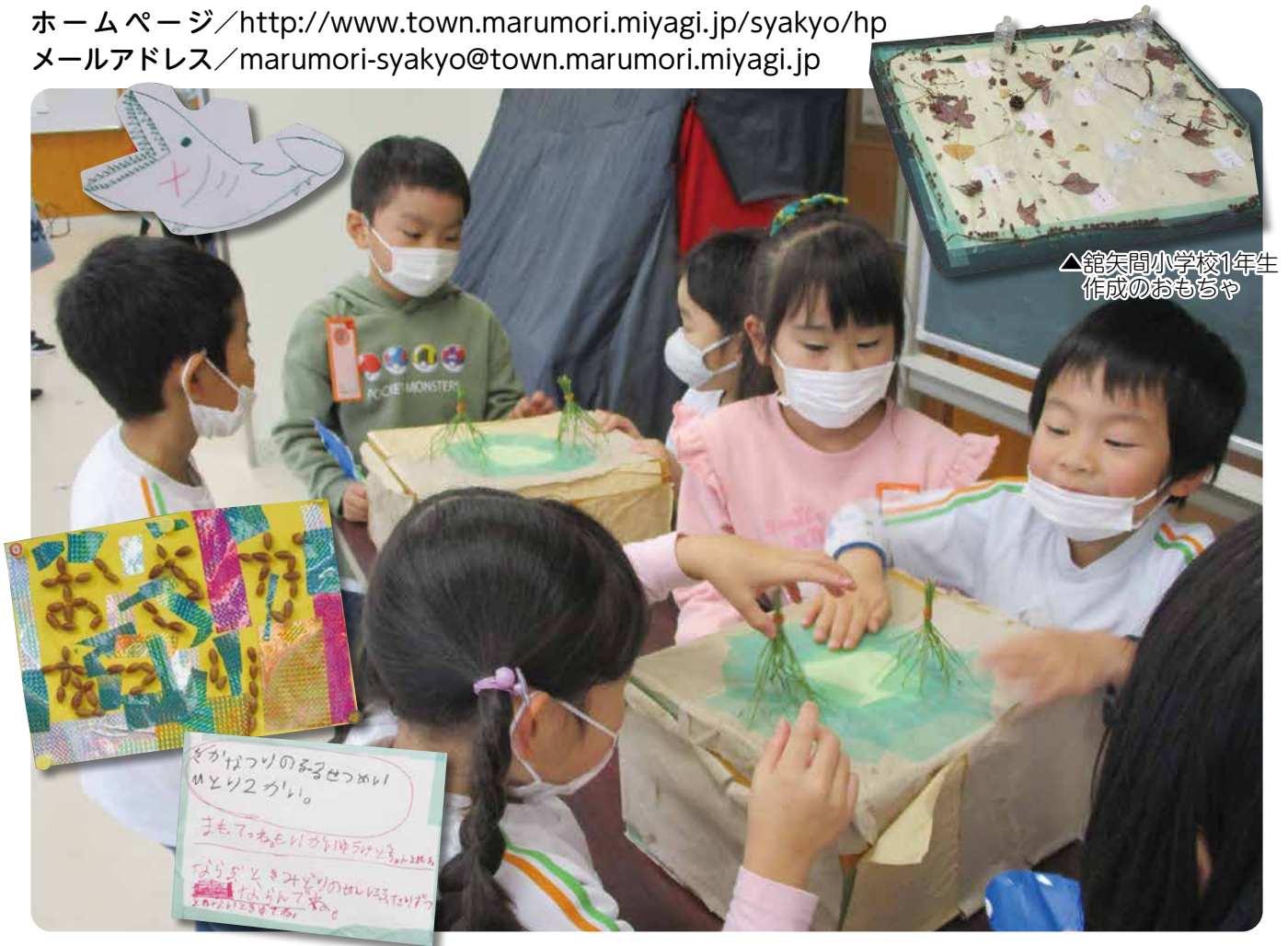
△館矢間小学校1年生 作成のおもちゃ

メールアドレス／ marumori-syakyo@town.marumori.miyagi.jp