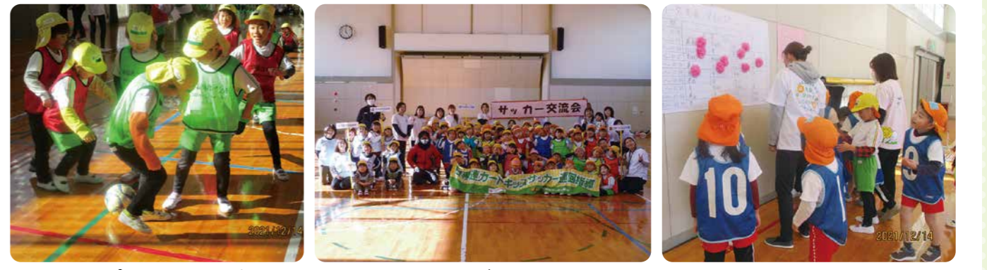
▲元気いっぱい走り回る子どもたち ▲4施設の年長児が勢ぞろいしました ▲勝ったチームにはお花を咲かせました

12月14日(火)丸森町民体育館において、4施設の年長児70名が集まりサッカー交流会を行いました。宮城県サッカー協会から派遣されたコーチ3名によるウォーミングアップ、2コートに分かれてのグループ対抗試合を楽しみました。4施設の年長児交流は初めての活動でしたが、サッカーを通してたくさんの友だちと交流し、思いきりからだを動かし笑顔いっぱいの子どもたちでした。