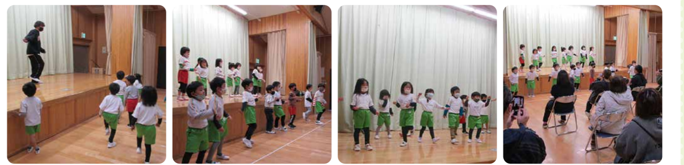
▲ダンスの先生の踊り方は僕たち私たちの憧れです! ▲みんなで踊ると楽しいね! ダンス大好き♪ ▲ミニ発表会♪お家の人がたくさん見に来てくれました!

12月に開催したミニ発表会では、今までみんなで取り組んできたBTSの曲“Butter”を発表しました。たくさんの保護者の方に見に来ていただき、お家の方もリズムにのりながら子どもたちの発表を見ていました。