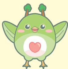
丸森町社会福祉協議会 マスコットキャラクター うぐたん