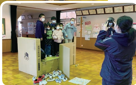
▲全員乗っても大丈夫！