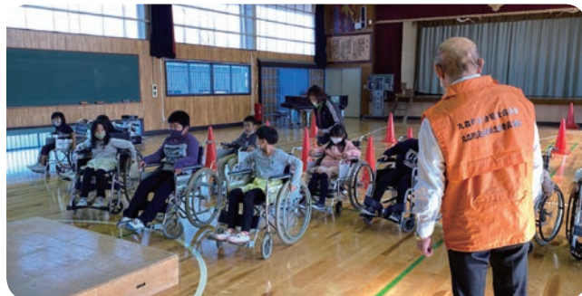
▲金山小学校の車イス体験 車イスの操作に悪戦苦闘

「町で困っている人がいたら、恥ずかしながら声をかけるようにしたい。」「福祉と丸森町をつないでみんながもっと住みやすい町にしたい。」など多くの感想が子どもたちから上がりました。