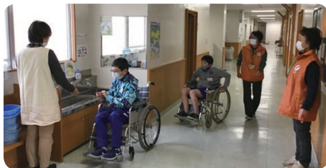
▲舘矢間小学校の廊下で車イス体験