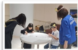
コスモハウスの皆さん、 応援ありがとうございます！