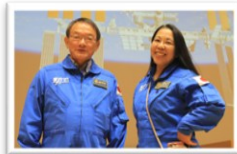
仲良し分団長&副分団長