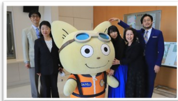
友情出演合唱の指揮と伴奏の先生、 合唱団の方々。こてつくんと一緒に 記念撮影☆