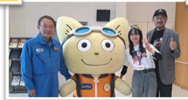
こてつくんと、こてつくんの アテンドお疲れ様でした。