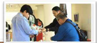
受付担当の分団の皆さん お疲れ様でした。