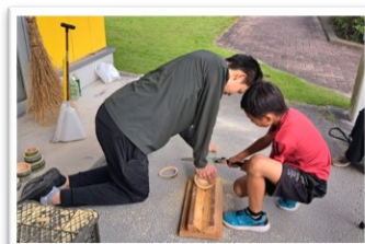
星座の「竹灯り作り」を制作指導中。

この一年、子どもたちと 宇宙のことを学び角田の宙 (そら)を身近に感じる活動を 続けてきました。 講演会やイベントを通じ、 未知の世界に目を輝かせる 姿に、私自身も元気を貰って います。 リーダーとして、これからも この街が「宇宙に近い場所」で ある誇りを大切にしたいです。 今年も遊び心と探究心を 忘れず、子どもたちの夢が ロケットのように高く羽ばた けるよう、全力で活動をリード していきます。