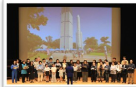
角田ベートーヴェン第九喜びのうたを歌おう会の皆様