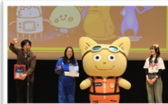
抽選会では宇宙兄さんズの小定様とこてつくんも登場!

講演会では、日本で初めて宇宙飛行士の訓練開発や、宇宙飛行士の審査を行った経験をもとに宇宙飛行士に必要な能力「心技体」についてなどのお話を頂きました。クイズや質問の時間ももあり参加しながら楽しく学び夢に近づく貴重な時間となりました。 講演の後は、友情出演の角田ベートーヴェン第九喜びのうたを歌おう会の皆様の「宇宙の子ども」合唱や、「サバ缶宇宙食」が当たる抽選会が行われイベントは、大盛況のうちに終えることが出来ました。