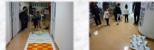
デッキスティックゲーム