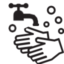
石けんによる 手洗い