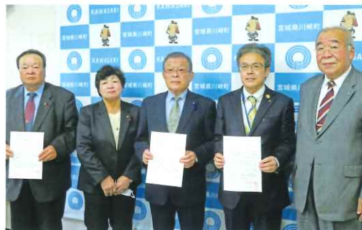
女性委員登用促進要請活動(R3川崎町)