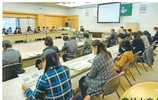
女性の社会参画に関する懇談会(R3大崎市)