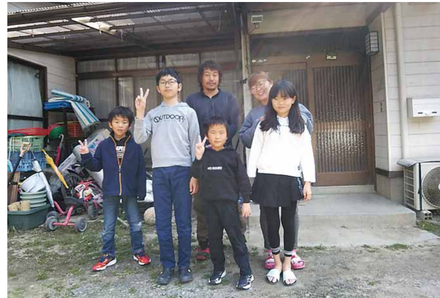
子どもがのびのびと過ごせる広い空き家に移住（大張地区）

答① 空き家等実態調査を行い4分類に区分し、空家台帳や空家分布図等を作成した。令和6年度中に空家等対策計画を策定するとともに、特定空家が出ないよう