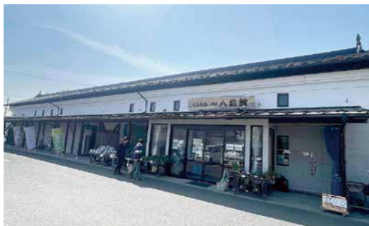
重要な観光拠点のひとつである八雄館

令和6年度に地質調査、新築工事設計、解体工事を行い、7年度に新築工事、8年度にオープン予定です。なお、工事中は同じ敷地内にて仮店舗で営業を続けます。