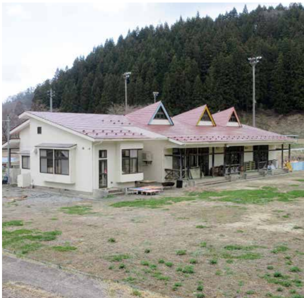
交流の場や宿泊施設として活用される旧筆甫保育所