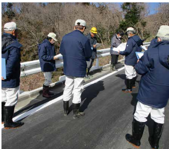
災害復旧が完了した林道鈴宇線（大内地区）