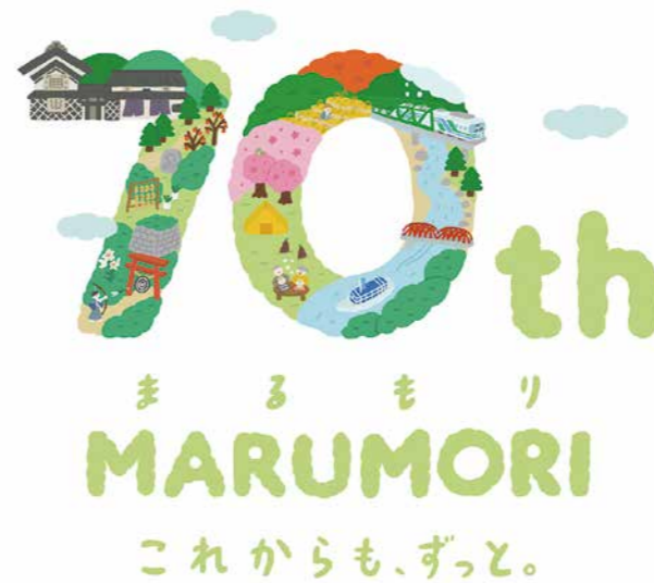
町内8地区の特色などを盛り込んだ、町政70周年記念ロゴマーク

問 まちづくりの基本指針となる次期総合計画策定に向けて、どのような観点で取り組むのか。 答 人口減少を大きな課題と捉え、移住定住の促進や関係人口の増加等に力を入れることで、若い世代に期待感を持ってもらえる計画となるよう努める。