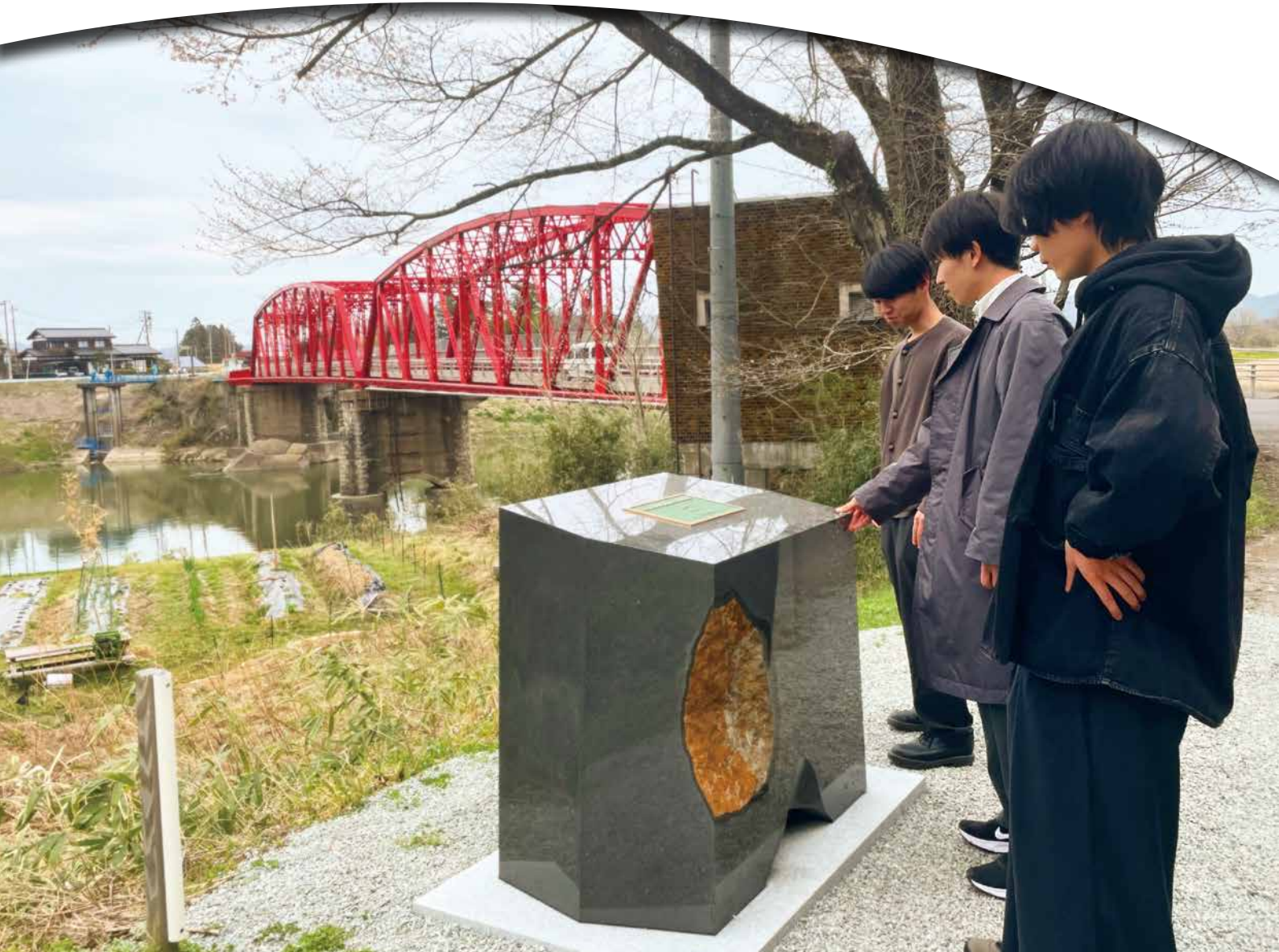
丸森橋が選奨土木遺産に認定！記念碑を設置