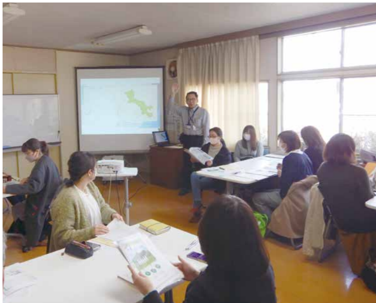
地域づくりを積極的に進める活動を学んだ、集落支援員視察研修会 (令和6年3月 大崎市)