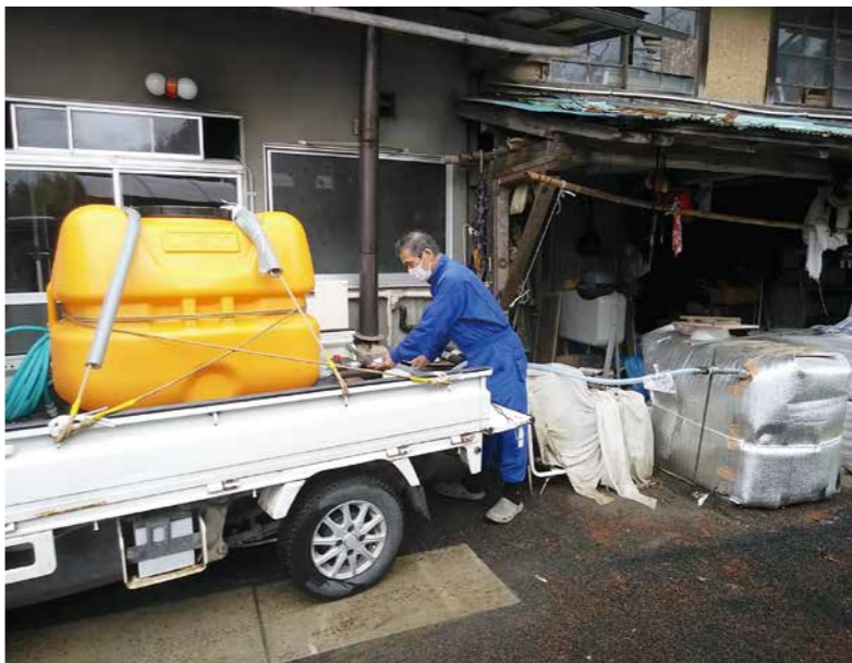
旧大張小学校で給水した水を自宅に運搬

答 15歳から64歳までの51人が、社会との関わりを6か月以上断っており、様々な悩みを抱えている。家族の協力も得ながら、居場所づくりに取り組んでいく。