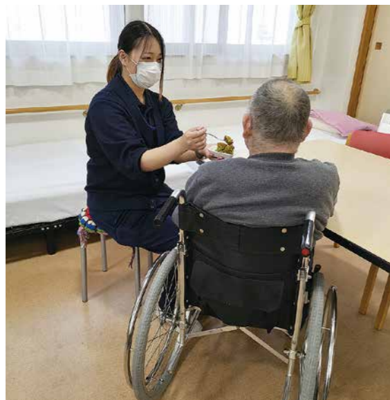
「おやつをどうぞ」優しく声をかける介助職員

問 結婚対策の事業はこれまで行ってきたが、実績が少ない状況である。今後、どう進めていくのか。 答 令和5年度のアンケートでは、婚活ではなく自然に出会いたいと回答があった。6年度は趣味や興味があるテーマで、集まりやすく交流しやすいイベントを開催する。