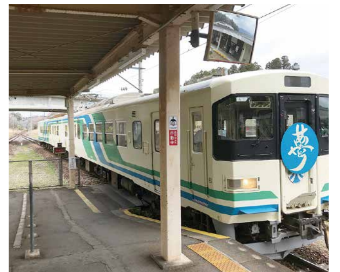
存続へ正念場、明日への夢と感謝を運ぶ我が阿武隈急行線

問 企業誘致や人材確保は、とても重要になると思うが、どのように考えているか。 答 企業立地奨励金や雇用奨励金の制度を整備し、企業に働きかけているが、人材の確保が課題である。ホームページへの求人情報の掲載や企業ガイダンスを継続していく。