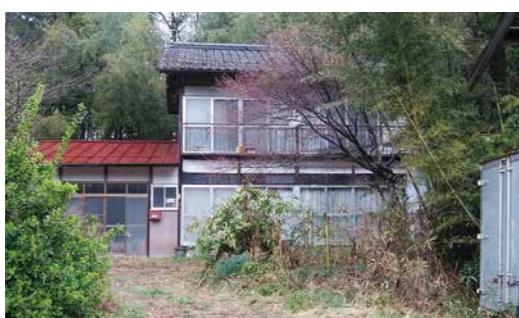
利活用が期待される空き家

これまでの空き家の再生、家財道具等の処分・清掃に加え、令和6年度からは空き家を解体した後に土地の売却や賃貸をするなど、土地を活用する場合に補助する内容を追加しました。