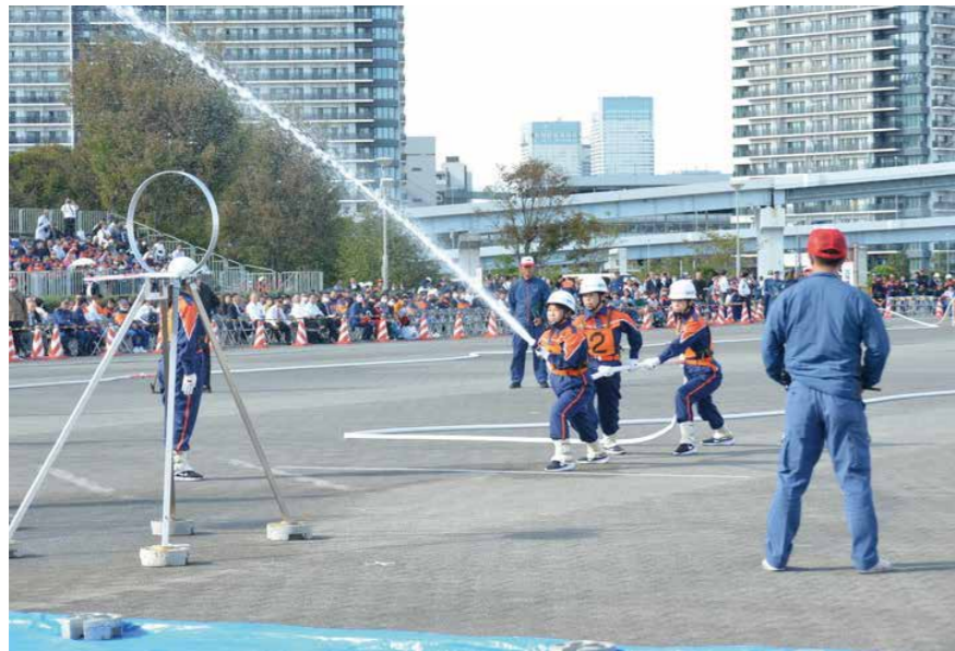
本町から1人が参加した全国女性消防操法大会（令和5年10月 東京都）

問② 消防団員の減少が続いている。今後、地域の防災力の低下が懸念されることから、確保対策を更に強化するべきではないか。 また、組織体制の見直しやアンケートの実施を行うべきと考えるがどうか。 答② 令和5年度から導入した機能別消防団により、充足率は96%となった。しかし、一部の班では団員の確保が進まず、今後の活動に支障が出るのが予想される。定年延長を可能とする条例改正や班編成の見直し等の組織再編を進め、アンケートの実施も検討する。 問③ 近年では、森林・林業に対する関心が高まっている。このような状況から、将来を生きる子どもたちへ