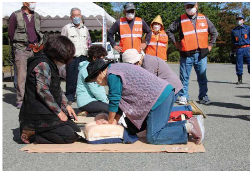
災害などに備え救命講習を受ける自主防災組織（館矢間地区）

問① 本町は4年半前に発生した東日本台風で甚大な被害を受けた。 また、新型コロナウイルスによる感染拡大で緊急事態宣言の発令などがあり、予期せぬ災害から住民の安全、安心を守ることは最優先課題である。 防災、減災の観点から今後の危機管理のあり方を町長に問う。 答① 災害から教訓として得たことは、町政に悪影響を与える要因を平時の段階から洗い出し、事態の発生を未然に防ぐとともに、危機的な状況に陥らないよう、事前の対策を立てるリスク