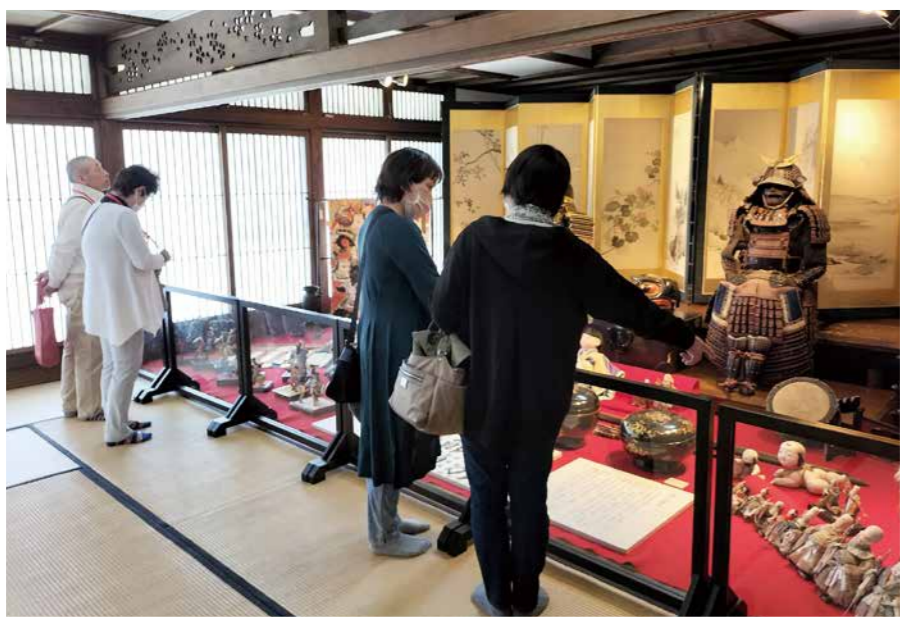
端午の節句でにぎわう齋理屋敷

所管事務調査、予算審査を通じ、各常任委員会から出された要望事項を取りまとめ、議会として9項目を町長に要望しました。