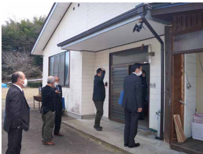
お風呂と洗濯室を無料開放している ころたけハウス（耕野まちづくりセンターとなり）