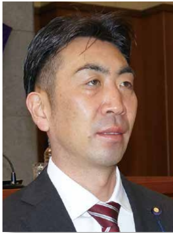
かなもり ひろゆき 議員 金森 裕之