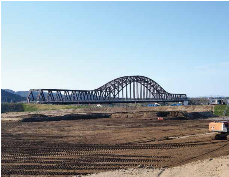
令和8年度の運用開始を目指し、造成工事中の河川防災ステーション