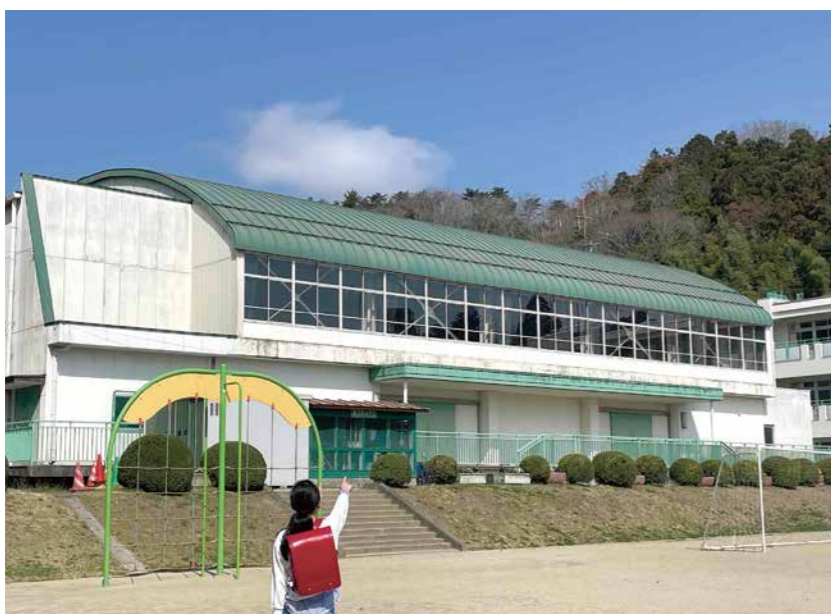
改修工事を行う丸森小学校体育館