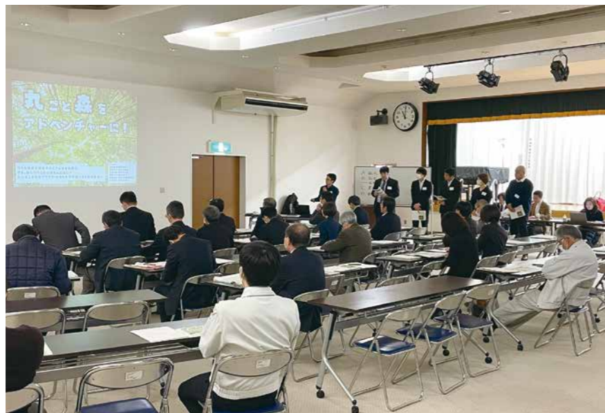
実現に向け具体的な提案がされた、官民共創次世代リーダー育成研修提案発表会

町政史上最悪の台風被害から、国や県と関係者の支援で着実に前進した復旧・復興計画が令和6年度に最終年を迎える。復興ビジョンに掲げた「共に立ち上がる次代につなぐ新たな丸森づくり」を検証して町の将来に伝承し、次期総合計画策定に反映することが重要と考え町長に問う。