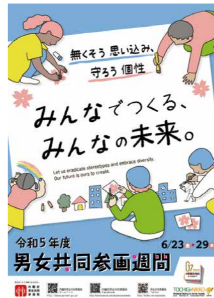
男女共同参画推進ポスター (内閣府ホームページ)

問③ ジェンダー平等について、学校教育でどのように進めるのか。答③ 教育長性の多様性についての理解を深めるため、蔵書等を増やしたり、児童生徒への指導を行うよう学校へ指示する考えであるが、大事なものは、教職員の意識を高めていくことである。