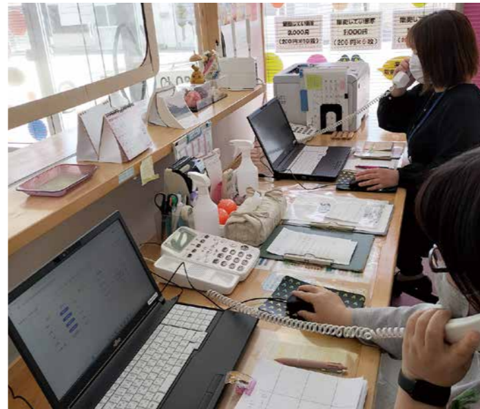
AIシステムを操作するあし丸くん予約センター

問① A-1活用で試験運行中の、あし丸くんのメリットとデメリットはどんな点か。利用者の声を反映させた利便性の向上に、どう取り組むのか。 答① 予約状況等で最適な経路を判断した効率的な運行で、車両を6台から4台に減らし年間約1000万円の経費削減を見込んでいる。デメリットは、意図しない配車の発生や、予約件数により時間通りに送迎できないことが考えられる。原因分析を行い早急な改善に務め、関係者と十分に協議して体制を整備する。