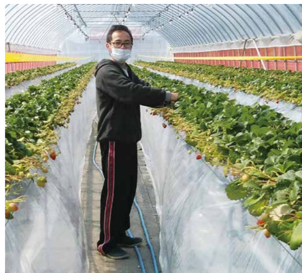
いちご栽培に取り組む農事組合法人(羽山の里佐野 大内地区)

問 観光の中心地にある八雄館は、どのように再整備を進めていくのか。 答 度重なる地震による耐震問題があり、現店舗を取り壊して新店舗を建設する。工事期間は仮店舗で営業を継続する。 中心市街地の拠点として、観光の活性化を目指す。