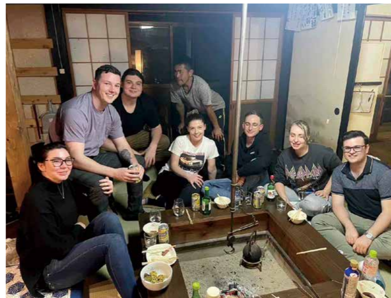
古民家の囲炉裏を楽しむ外国人観光客（まるもりホテル 筆甫地区）

問⑥ 空き家を町主導で整備し、短期滞在型の賃貸物件にすることで、移住のための足掛かりにはできないか。 答⑥ 空家等対策計画の策定に取り組み、国が示す条件等を勘案しながら、本町に適した空き家の活用策を検討していく。