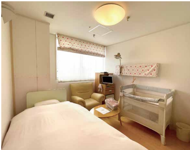
内装や備品にもこだわり産後の母子が安心して過ごせるよう整えられている産後ケア専用ルーム（スズキ記念病院 岩沼市）

※産後ドゥーラとは 産前産後の母親の心身の安定と産後の身体の回復のため、家庭を訪問して育児や家事等のサポートを行う。