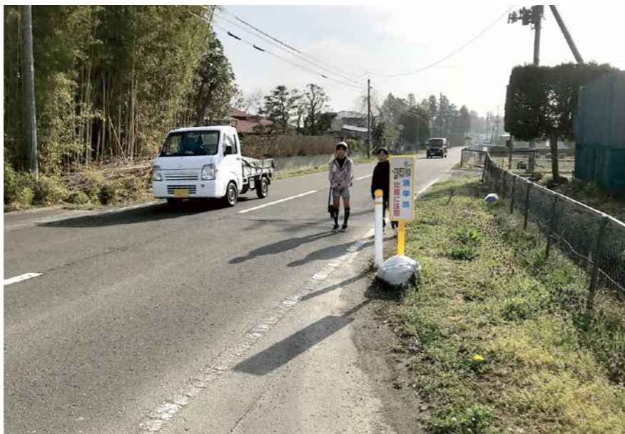
通学路歩道総延長1560メートル（赤崎線 館矢間地区）