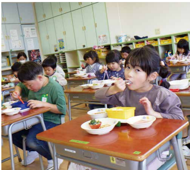
副食費も完全無償化に (丸森たんぼぼこども園)

これまでは保護者が保育料等を一度施設へ納付し、同額を町が助成していましたが、完全無償化により保護者の負担軽減を図ります。