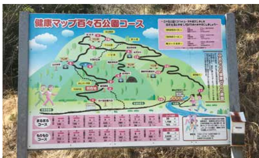
新たな観光資源として再整備を進める百々石公園

令和6年度から7年度にかけて、公園入口や第2広場の展望台、園路の整備を行います。低山トレッキングも取り入れながら、河川防災ステーション等とも連携し、まちなかの観光拠点としての活用も進めます。