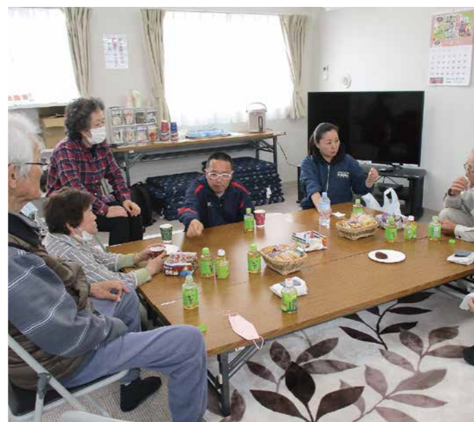
神明サロンで住民同士の交流を支援