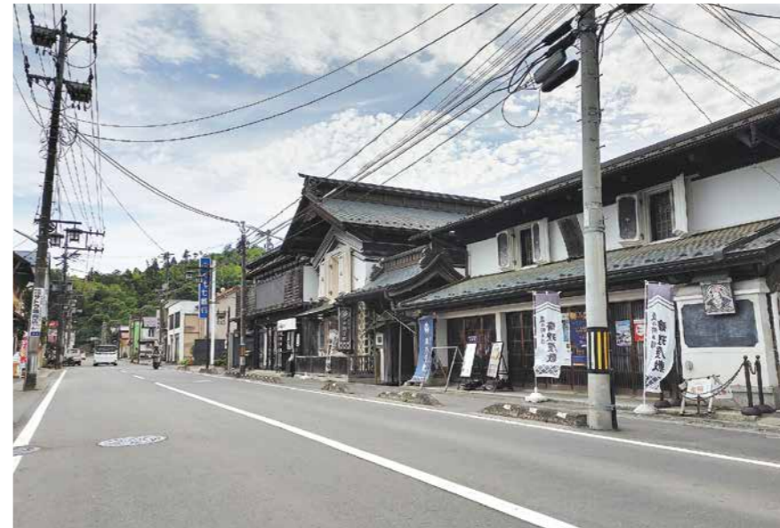
にぎわいづくりに向け整備を検討（斎理屋敷周辺商店街）

県との連携を図りながら、どのような取り組みを進めていくのか。 答① 観光振興計画に基づき、斎理屋敷前県道の町道化や無電柱化、車歩道境界ブ