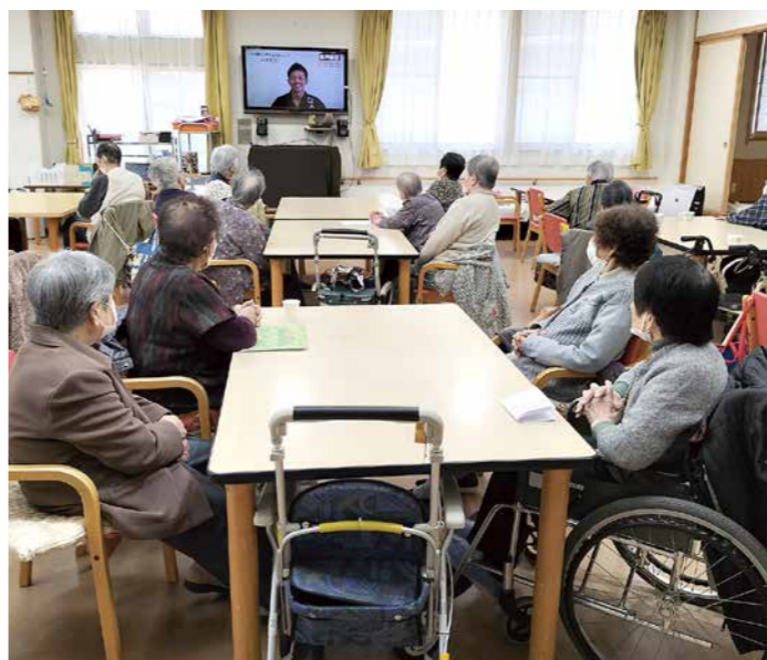
DVDで体操したり、介護施設で今日も楽しく過ごしましょう

保険料額を引き上げ、第1段階から第3段階までの低所得者の保険料額を引き下げること、低所得者の保険料負担の抑制を図ります。 なお、改正後の保険料の段階は、前年度の所得が確定した8月以降に通知されます。