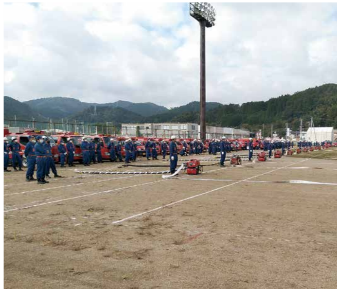
住民の防災を支える消防団員（令和4年秋季消防訓練）

防力の維持を図るため、基本団員の定年を65歳から70歳まで延長できるように条例を改正しました。 なお、各団員の定年は、機能別団員が75歳、正副団長、正副分団長、ラッパ隊正副隊長は定年はありません。