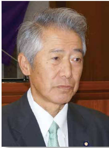
わたなべ まさみ 議員 渡辺 政巳