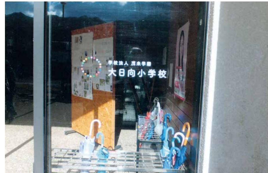
イエナプランを採用している大日向小学校（長野県）