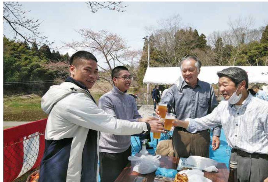
ベトナムからの技能実習生も参加して楽しんだ桜を観る会（大張地区）

問② 外国人技能実習制度のもとに町にも多くの技能実習生が外国人登録をしており、これまで町は、宿泊施設の提供など、受け入れを支援してきた実績がある。今後、外国人育成就労制度に変わると、就労条件の良い都市部への流出も懸念されるが、町は支援策の充