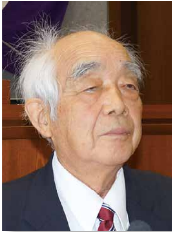
いたばし 板橋 議員