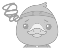
みやぎハローワークキャラクター ガンちょーさん