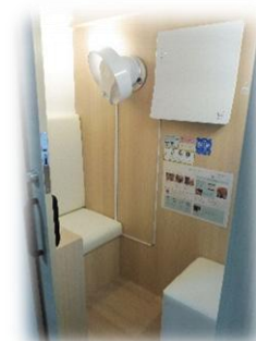
中にはソファースツールがあり、つなげれば おむつ替え用のベッドになります。