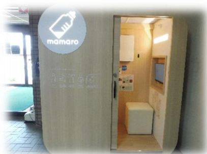
正面玄関を入ってすぐ左手です。 箱型の個室で施設できます。

役場1階ロビーにおむつ交換や授乳が行えるベビーケアルームを設置しています。役場に手続きに来た時だけでなく、お散歩やお買い物の合間の授乳やおむつ交換にぜひご利用ください。