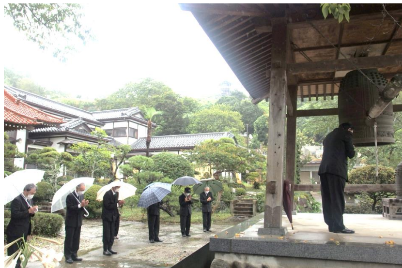
▲ 正午の時報とともに黙祷を捧げる役員の方々

8月15日（日）鶴棲山遊仙寺において、小斎地区の戦没者慰霊祭が執り行われました。