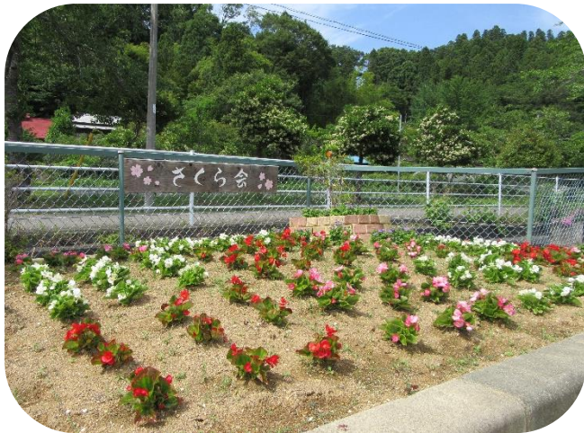
▲ 今年6月に植え替えを実施。

麓さくら会の花壇は、麓の集会所とごみ集積所に隣接しており、普段から地域のみなさんがよく訪れる場になっています。