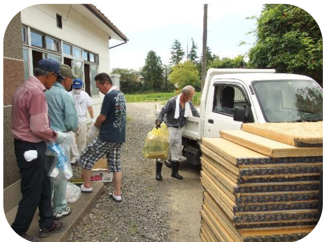
▲ 片付け作業の様子