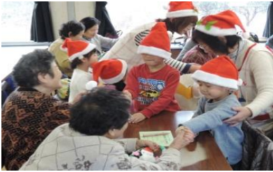
子供達からクリスマスプレゼント