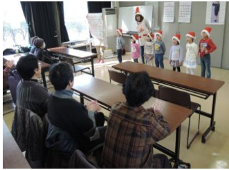
子供達によるお遊戯