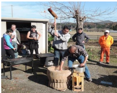
西向収穫祭 11/26 餅つき