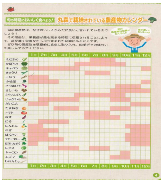
丸森で栽培されている農産物カレンダー

大内についての情報が少ないのでどんどん学びたいと思っています。特に農業分野を学びたいので、収穫やこれを見に来てなどあれば情報をお待ちしています。