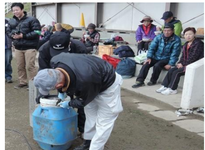
羽山まつり 11/19 タイムカプセル