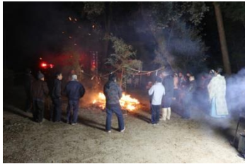
青葉地区 熊野神社どんと祭(1/14)