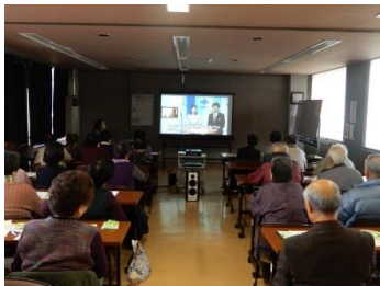
生きがづくり大内 (1/18)