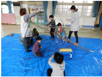
大内保育所団子刺し (1/10)