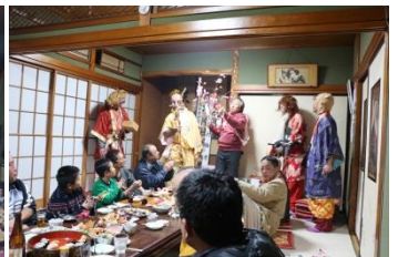
上町地区かせどり (1/14)