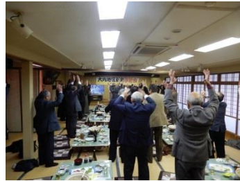
大内地区新年祝賀会 (1/24)