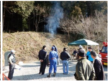
中平・山屋敷地区 熊野神社どんと祭(1/14)