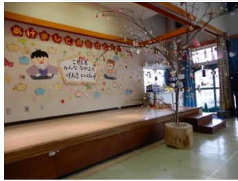
大内保育所団子刺し (1/10)