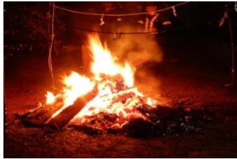
青葉地区 熊野神社どんと祭(1/14)