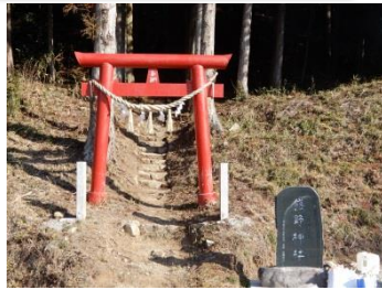
中平・山屋敷地区 熊野神社どんと祭(1/14)