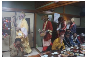
上町地区かせどり (1/14)