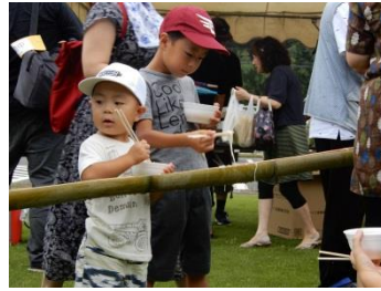
いきいき交流センター 大内夏祭り(8/10)