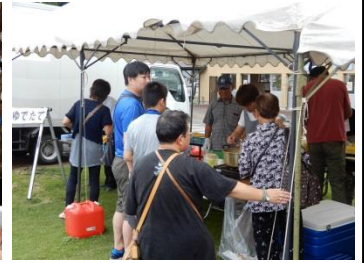
いきいき交流センター 大内夏祭り(8/11)