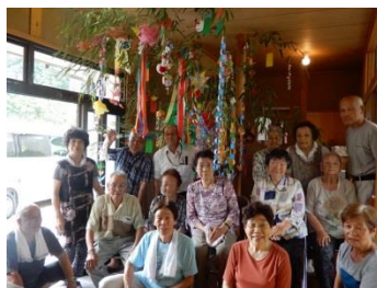
山屋敷お茶のみ会 (8/7)