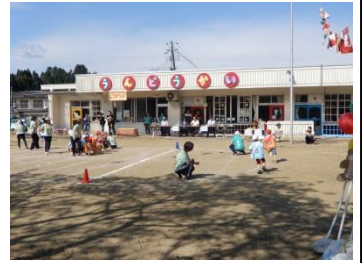
大内保育所運動会 (10/5)