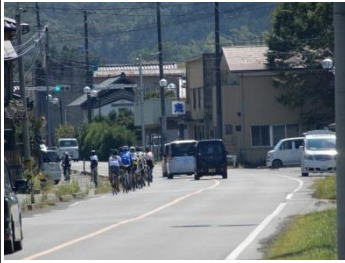
サイクルフェスタ丸森 (10/5)