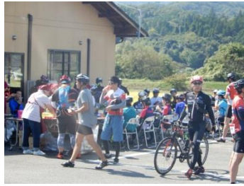
サイクルフェスタ丸森 (10/5)