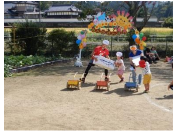
大内保育所運動会 (10/5)