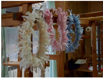
佐野地織保存会 クズ繭を活用(12/2)