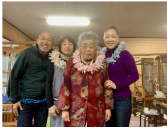
佐野地織保存会 レイの完成(12/2)