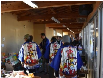
初売り時の大抽選会 (1/4)