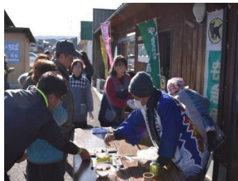
初売り時のあんこずすり (1/4)