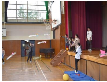
子どものあそび場 (12/15)