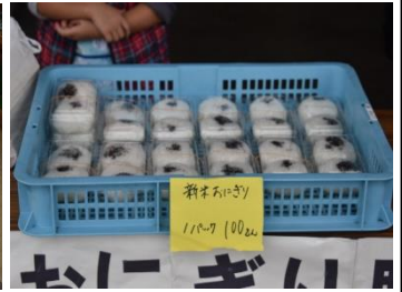
いきいき交流センター 新米まつり(10/11)