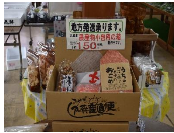
いきいき交流センター 新米まつり(10/11)