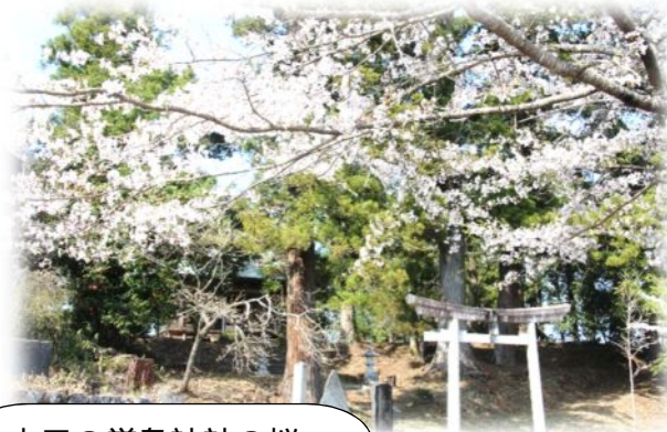
山田の巖島神社の桜