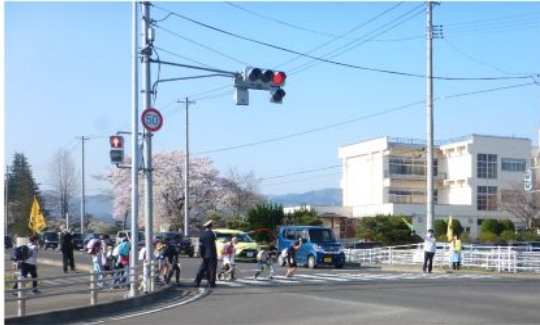
館矢間小学校付近交差点

朝の通勤通学で混雑する時間帯、部会員や館矢間小学校教員の方たちが館矢間小学校交差点と照井建業前交差点に立って皆さんの安全を見守りました。