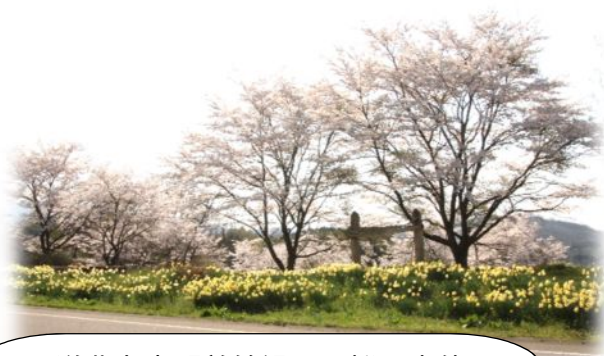
町道北丸森駅前線沿いの桜と水仙