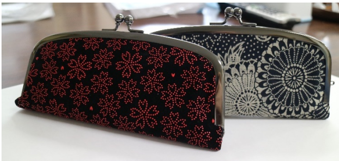
『がまぐちのオシャレな眼鏡ケース』

1月24日(日)に、大張各種婦人会の役員研修会が開催され、16名のみなさんが参加されました。趣味の作品展に出品するための作品を作りました。今回はオシャレな眼鏡ケースを作りました。ポンドで布をはったり、金具にはめ込んだり、慣れない作業でしたが皆さん夢中になって取り組んでいました。