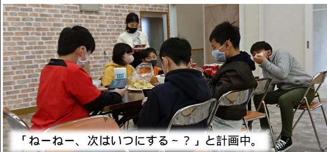
「ねーねー、次はいつにする〜?」と計画中。