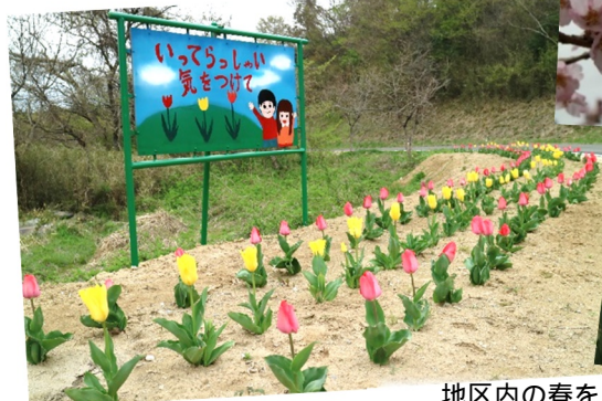
チューリップロード