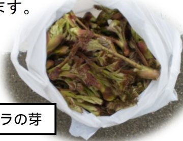
被害品のタラの芽

現時点ではタラの芽が主な被害品になっていますが、これから、わらび、筍と続きますので、規制表示などのご協力お願い致します。