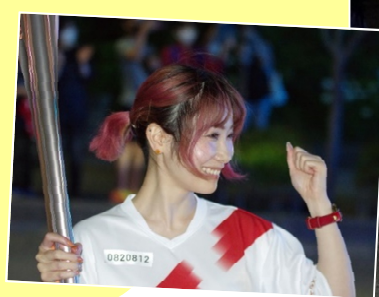
聖火リレーコンセプト Hope Lights Our Way 希望の道を、つなごう

トーチは長さ71cm、重さ1.2キロ。アルミ製で日本人に最もなじみの深い桜をモチーフとしているそうです。