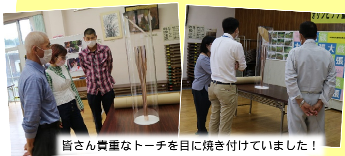
皆さん貴重なトーチを目に焼き付けていました！

トーチは長さ71cm、重さ1.2キロ。アルミ製で日本人に最もなじみの深い桜をモチーフとしているそうです。