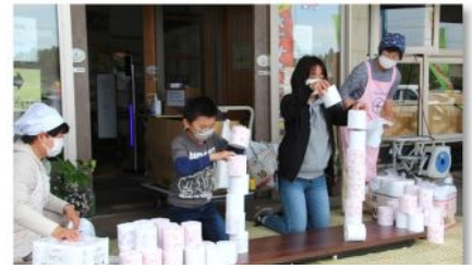
トイレットペーパーチャレンジ!