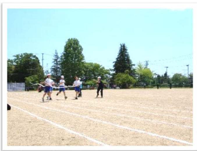
5月24日(火) 徒競走の様子

5月22日(日) 3校再編後、初の『館矢間小学校大運動会』を開催！ですが天候が悪く、全校パフォーマンス終了後、残念ながら2日後に延期が決定。 24日(火)は天気も良くイイ運動会日和となり青空の下、玉入れや徒競走、リレーと一生懸命取り組みました。