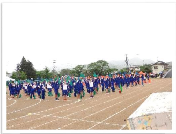
5月22日(日) 全校パフォーマンスの様子