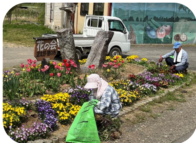
▲ 源太郎花の会の花壇