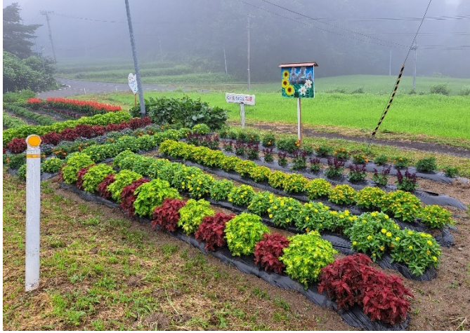
(A) 1区の2 松ノ塚仲よし会