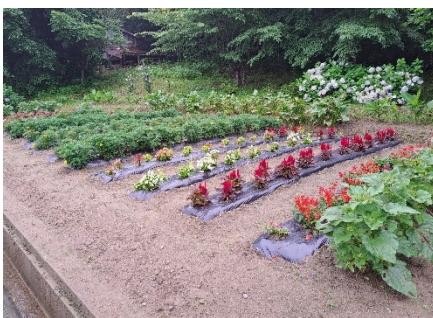
(A) 1区の1 市ノ沢花壇部会 / 7区 花壇部会