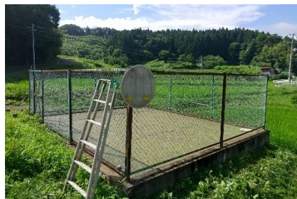
防火水槽まわり・看板交換