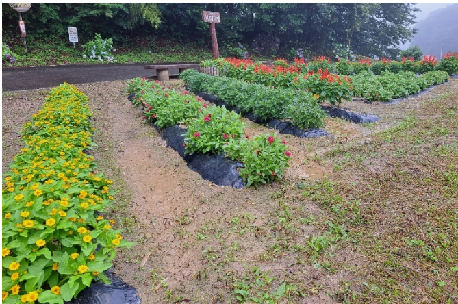
(A) 3区 みちばた花壇