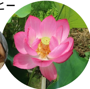
つぶっこさんの営業日などは 「カフェ つぶっこブログ」をご覧ください！

玄関にマコモのスタレのれん...マコモの葉は浄化作用などがあるそうです！ 葉や葉を粉末状にしてお風呂に入れると水が腐らないとも言われています。 優れた体内浄化作用もあるので、アトピーや切り傷にも最適だそうです！