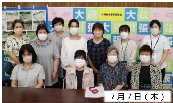
汁物は1日2杯以内で塩分調節をしましょう！