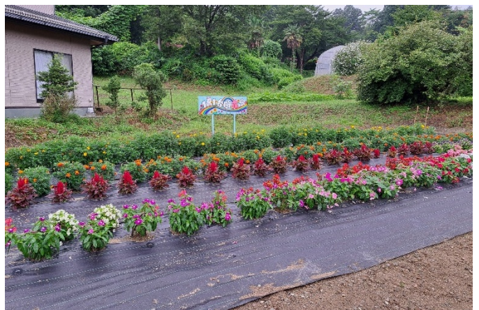
(B) 1区の1 台花壇部会