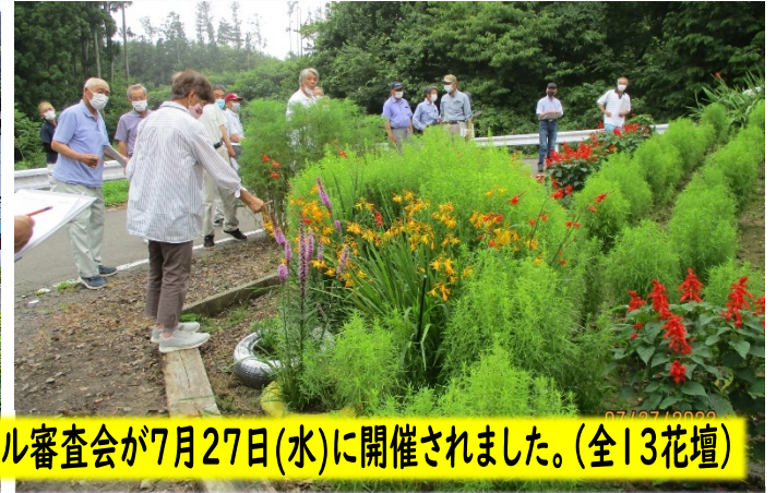
花壇コンクール審査会が7月27日(水)に開催されました。(全13花壇)