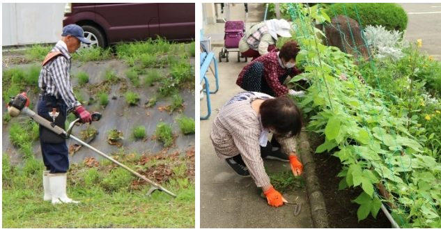
長寿会の皆さん、大変ご苦労様でした。 毎年本当にありがとうございます！