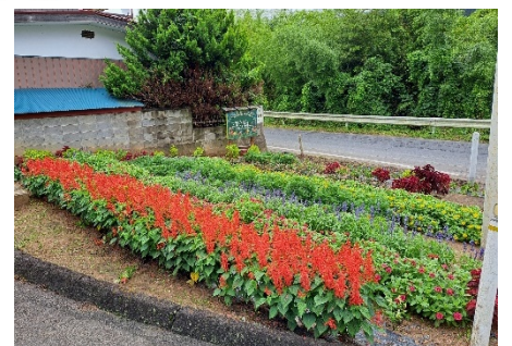
(B) 1区の2 志賀久保花の会