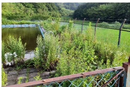
旧西中学校プールまわり

7月10日(日) 丸森町消防団大張分団の草刈り作業が行われました。旧西中学校プールまわり、大張地区内防火水槽、ポンプ小屋まわりの草刈りと整備、古くなった防火水槽の看板交換も行いました。朝7時からお昼頃まで半日かかりの作業、暑い中大変ご苦労様でした。