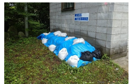
ポンプ小屋まわり