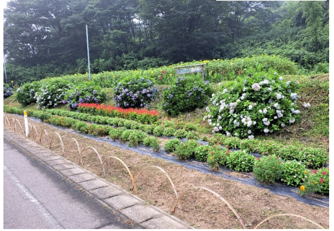
(B) 3区 土曜会花壇部会