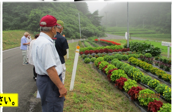
❁花壇コンクール審査会・結果は別紙をご覧ください。