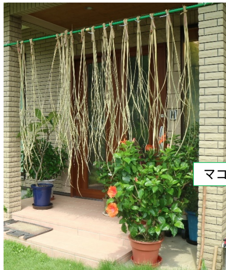
マコモのれんをくぐり無病息災！