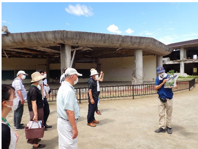
語り部から説明を受けている様子