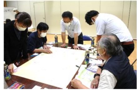
アイデアを出し合い中

この検討会は、昨年3月に「館矢間地区別計画書」が改訂され、その策定している中で地区内の方から「子どもたちが遊べる公園や広場が欲しいね」とか「地区内に避難場所の確保が課題」だとか意見がでました。