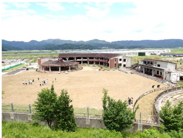
近くの山から望む大川小学校の全景

館矢間小学校が実践研究している「地域連携型学校防災体制等構築推進事業」の一環で館矢間小教員及び館矢間、大張、耕野地区の自主防災組織関係者が震災遺構の石巻市の大川小学校と門脇小学校を視察研修してきました。大川小学校では語り部ガイドから当時の様子を伺いました。