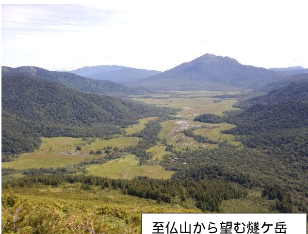
至仏山から望む燧ヶ岳

さて、私事になりますが、年とともに朝4時ころに目を覚ますことも多くなり、何気なしにテレビをつけると山の景色が放映されています。先日は尾瀬が紹介されていました。若い頃は代表的な山である燧ヶ岳と至仏山にも登りましたが、今はやはり尾瀬ヶ原や尾瀬沼に心が奪われます。「夏が来れば思い出す はるかな尾瀬 遠い空 . . . . .」さすがに唱歌として歌われている絶景地かと思えます。高山植物に目を奪われながらゆっくりと尾瀬ヶ原の木道を歩きたいものです。