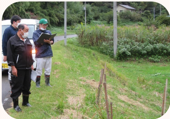
▲ 調査の様子（清水下保全会）

10月5日（水）丸森町農林課職員立ち会いにより、対象区域で適正に活動が実施されているか調査が行われました。