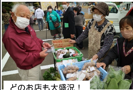
どのお店も大盛況！