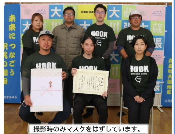
撮影時のみマスクをはずしています。