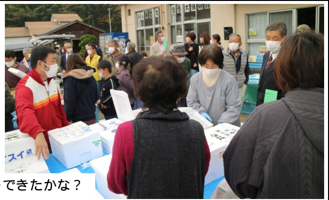
お目当ての物はゲットできたかな？