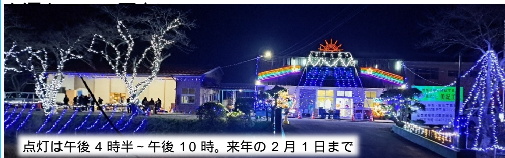
点灯は午後4時半～午後10時。来年の2月1日まで

寒い冬の夜をキラキラのイルミネーションが彩り、大張の映えスポットになること間違いなし! イルミネーション前にはベンチもありましたよ～。カメラ・スマホを持ってレッツゴー!