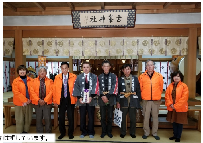
撮影時のみマスクをはずしています。